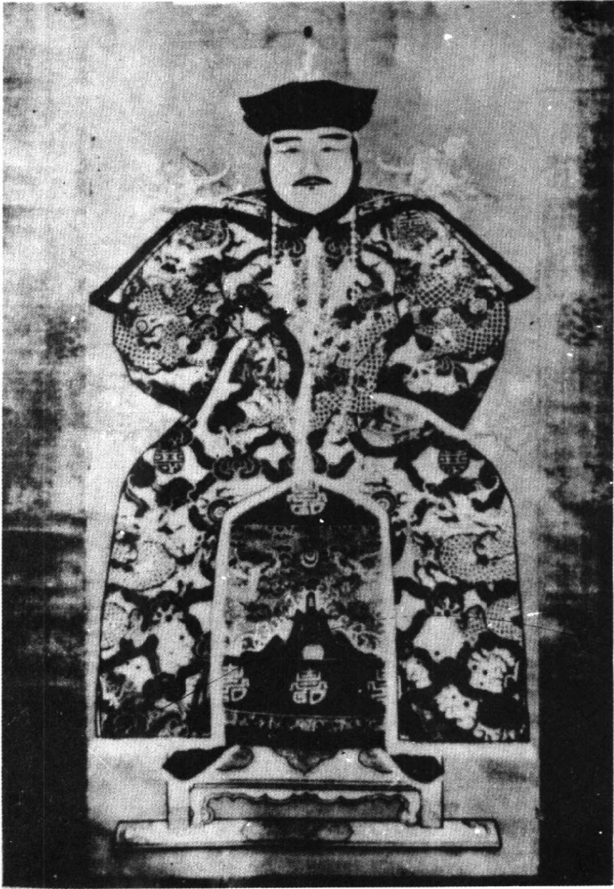
三 信郡王多尼画像