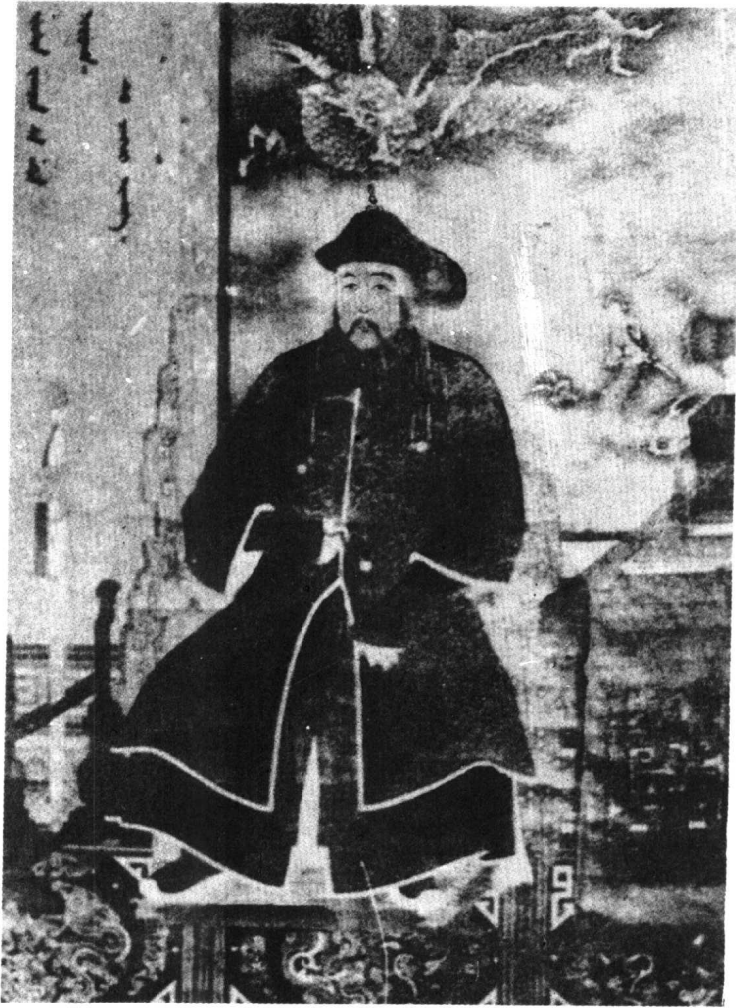
一 睿亲王多尔衮画像