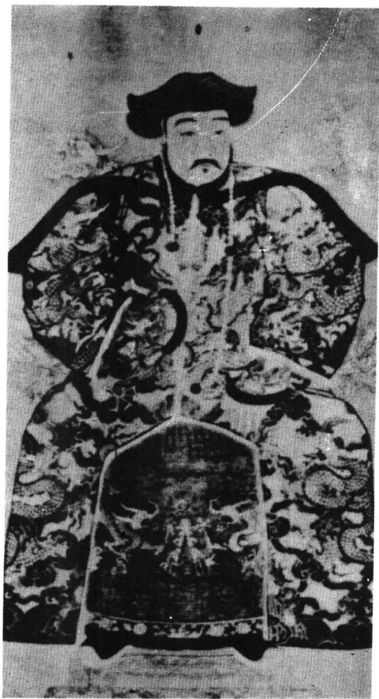
二 豫亲王多铎画像