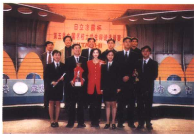
吉林大学代表队在第五届中国名校大学生辩论赛上获得冠军