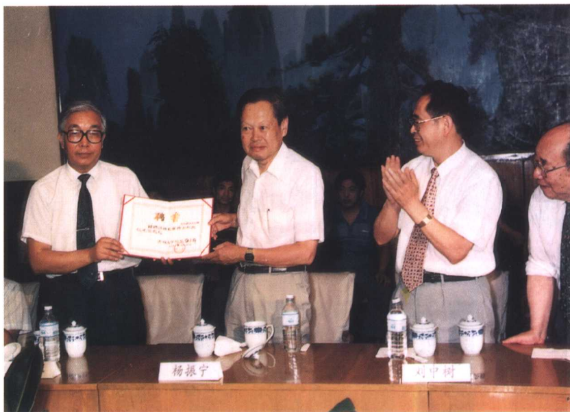
聘请美籍华人、诺贝尔奖获得者杨振宁博士为名誉教授