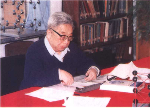
名誉校长唐敖庆院士