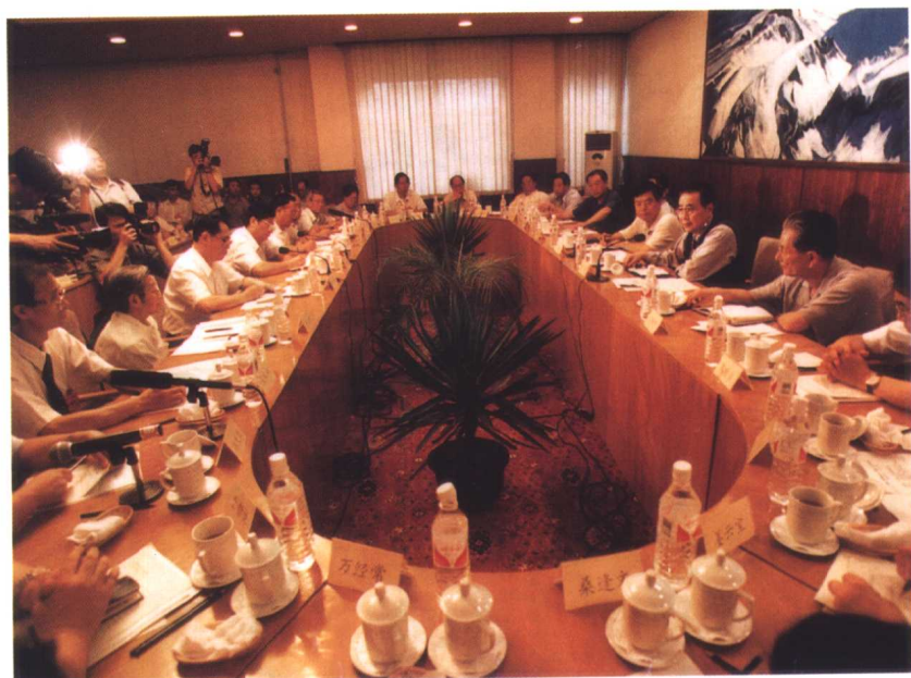
李鹏委员长到吉林大学新校区参加“吉林省高校《高等教育法(草案)》征求意见座谈会”