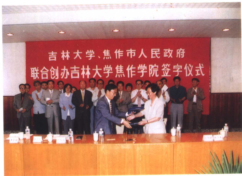
吉林大学与河南省焦作市联合创建吉林大学焦作学院，为地方培养人才