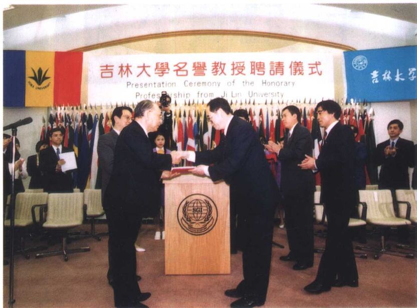
聘请国际创价学会会长池田大作先生为名誉教授