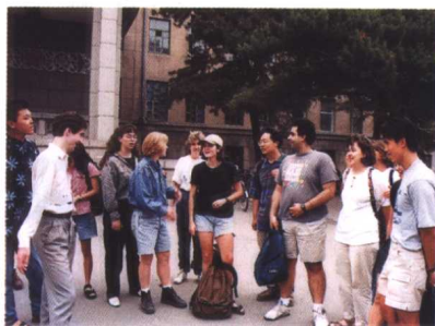
在校学习的外国留学生