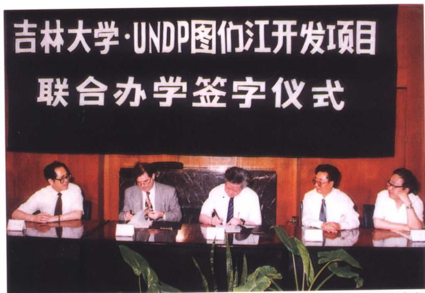
吉林大学与联合国开发计划署联合东北亚区域国际合作开发培养外国留学研究生