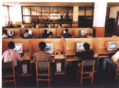
图书馆电子阅览室