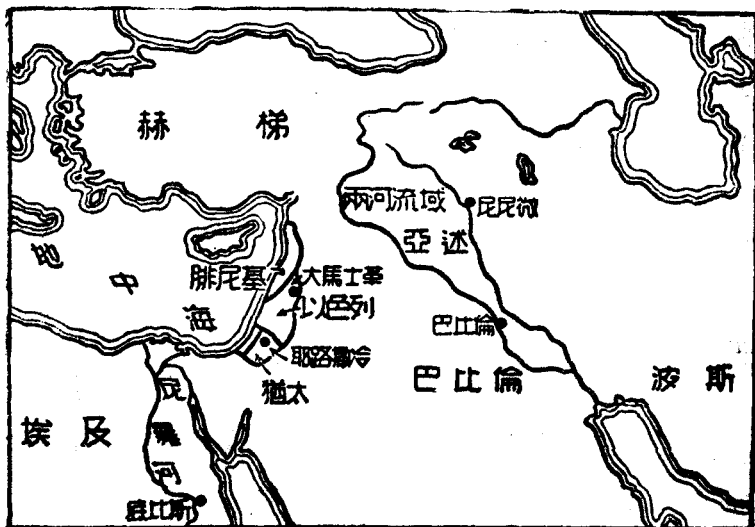
古代亞非國家位置圖