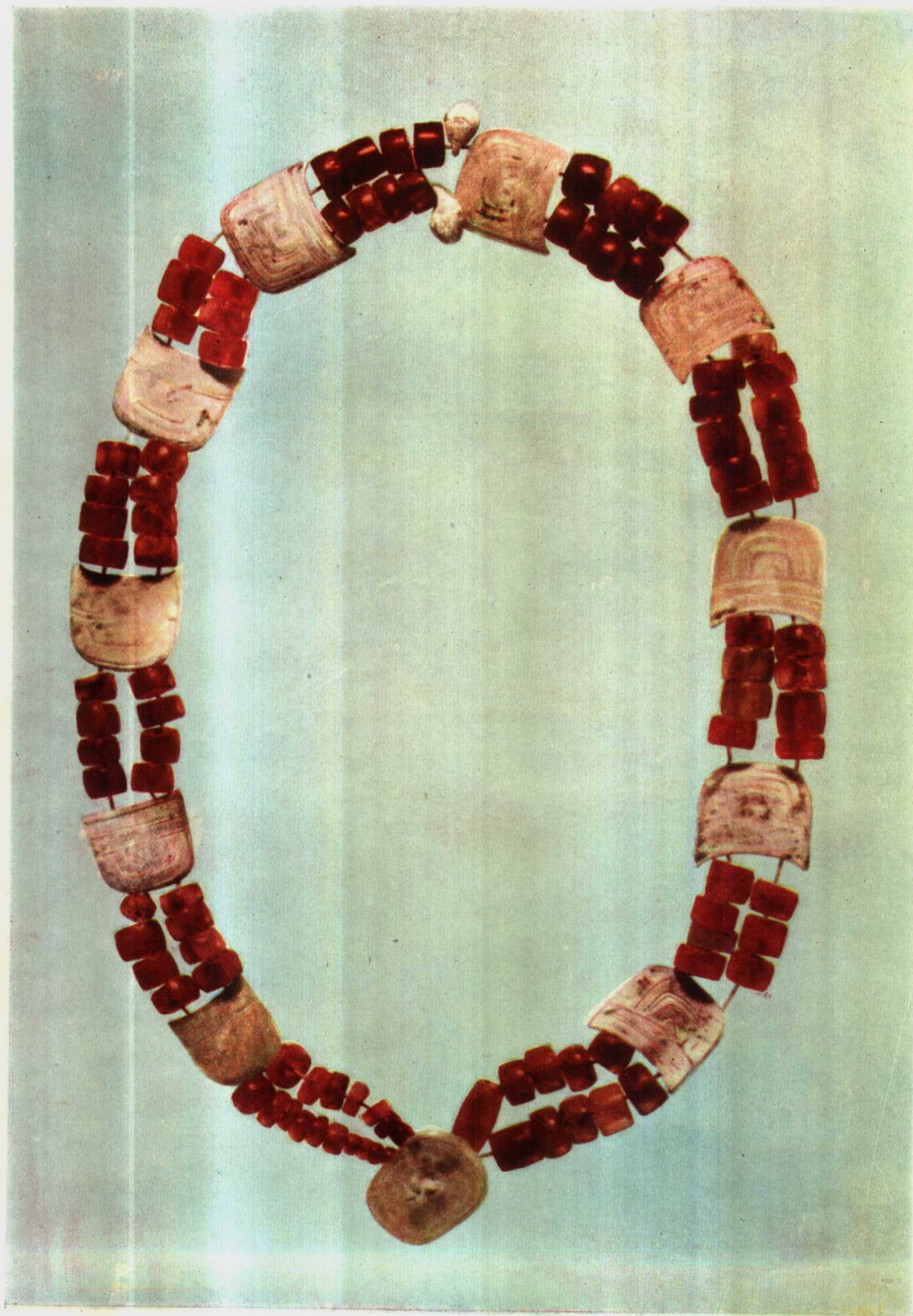
成組串飾 1820 : 33 (頸部)