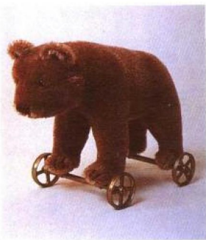
仿自十九世纪初，站在四轮上的木制熊（on all fours）玩偶。

你知道泰迪熊和一般熊熊的差别在哪里吗？还有熊熊是怎么来的呢？它又怎么会成为一般家庭中受欢迎的玩具，甚至流传出一种温馨的熊熊文化？