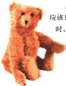
35PB熊为德国史泰福工厂十九世纪初移民到美国开疆拓土的熊祖之一。

严格来说，我们现在一般常见的绒毛熊，并不能算是真正的泰迪熊。如同车子具有不同外型、规格、厂牌一样，绒毛熊也有各种不同的品牌、风格、外貌，甚至设计师，没有办法以泰迪熊来代表所有的熊熊，然而由于泰迪熊实在被应用得太广泛了，人们往往便将所有的绒毛玩具熊通称为泰迪熊。