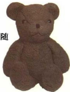
这只已经陪伴了主人十二年岁月的小熊，虽然毛色和光泽已不同原样，也非系出名门，对主人而言却具有无法衡量的价值。

早期的泰迪熊主要是供小孩玩耍和陪伴小孩的玩具，然而随着时间发展，泰迪熊对欧美一般家庭而言，常承载着非常个人的特殊情感，以及文化遗产的意义，譬如一只年岁悠长的泰迪小熊便可能陪伴过一个家庭的祖孙三代，可说是一种悠久的熊熊温馨文化。即便不是作为收藏，一般家庭送熊或是买熊都非常普遍，我们可以看到有些欧美家庭中保有一只流传了两三代的熊，更不用提那些会收藏熊熊的人们了。事实上，这些人认为只有欧洲血统的熊，才是真正的熊，至于后来居上的其他地区所制造的熊，尤其是大量机器加工制造的绒毛熊，根本不被他们看在眼里，还认为这些熊完全称不上是熊。由此可见欧美国家重视熊的程度，以及为何会有许多人如此重视拍卖熊和古董熊的原因。