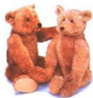
早期的熊看来较为写实，鼻子也较为尖长。这两只古董熊已经有九十年以上的历史了。

然而翻开绒毛熊的发展历史，在百年岁月的洗礼下，伴随着科技的发展和机器加工的趋势，早在1950年后期开始，除了手工熊们外，又开辟了一条新路。这些可怜的绒毛小熊未被赋予过去手工泰迪熊的辉煌名衔和特殊启示，在熊史的洗礼和改良下，丝毫没有喘息和停歇空间，只得不断地被淘汰和创新。相对于现