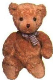
与传统手工熊截然不同的现代绒毛熊，为1990年代出生的机器熊。

代快速多变的喜好和繁杂多样的选择，这些机器小熊只能悲惨地面对人们以娃娃、布偶，甚至是填充玩具等毫无情感的名字相称的命运。虽然各自有着精致、美丽的脸庞，但现在的绒毛熊们过于工笔、完美的机械制造过程，却使得它们缺乏“熊性”，也缺乏熊熊本身的独特风格。所幸，独立熊熊设计师（bear artist）带着他们所制造的风格独具、又充满现代特色的手工熊在1970年代出现，对于熊界来说，堪称一股清流。