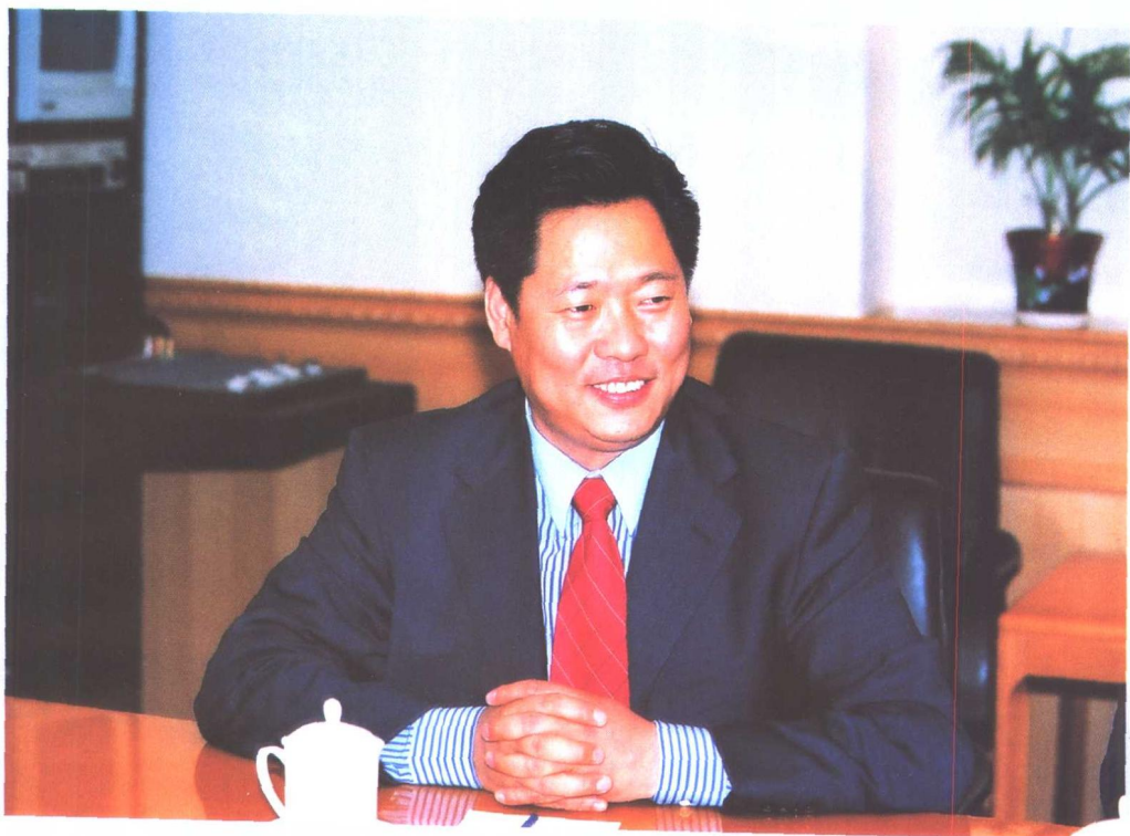
财政部会计司司长刘玉廷先生