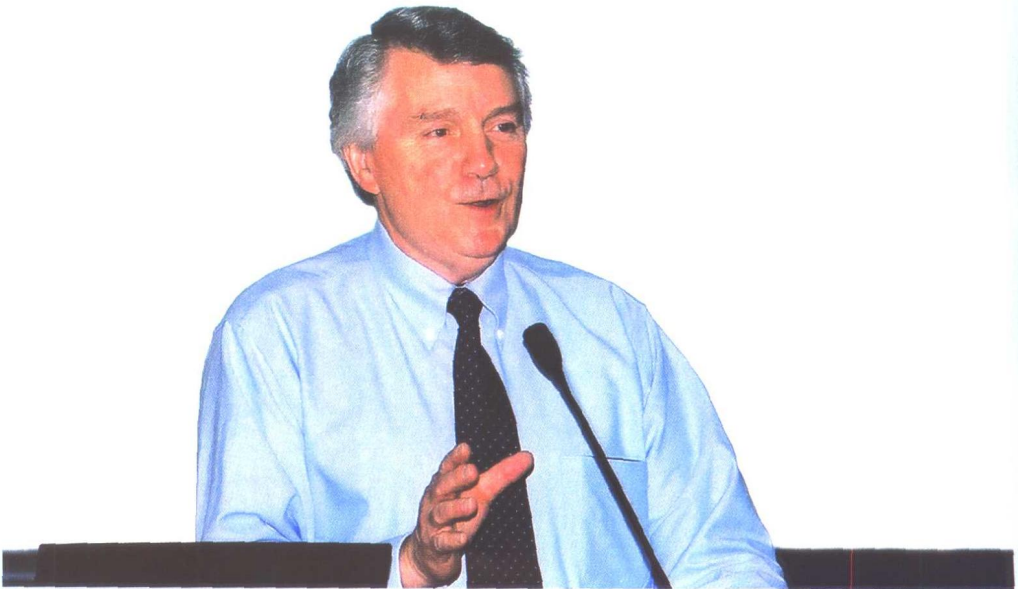
前美国政府会计师协会主席比尔·布罗德斯先生