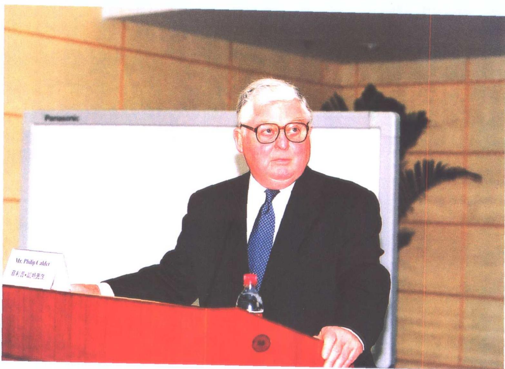
美国会计总署首席会计师菲利普·凯特先生