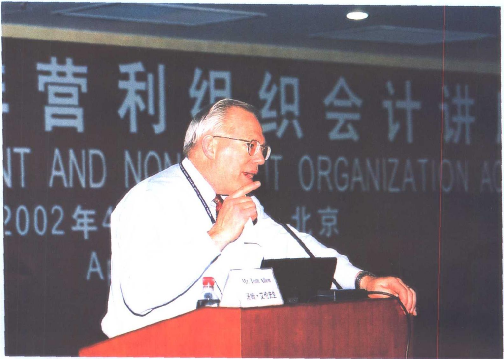
美国政府会计准则委员会主席汤姆·艾伦先生