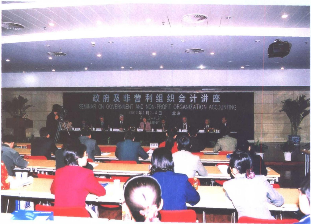
政府及非营利组织会计讲座现场