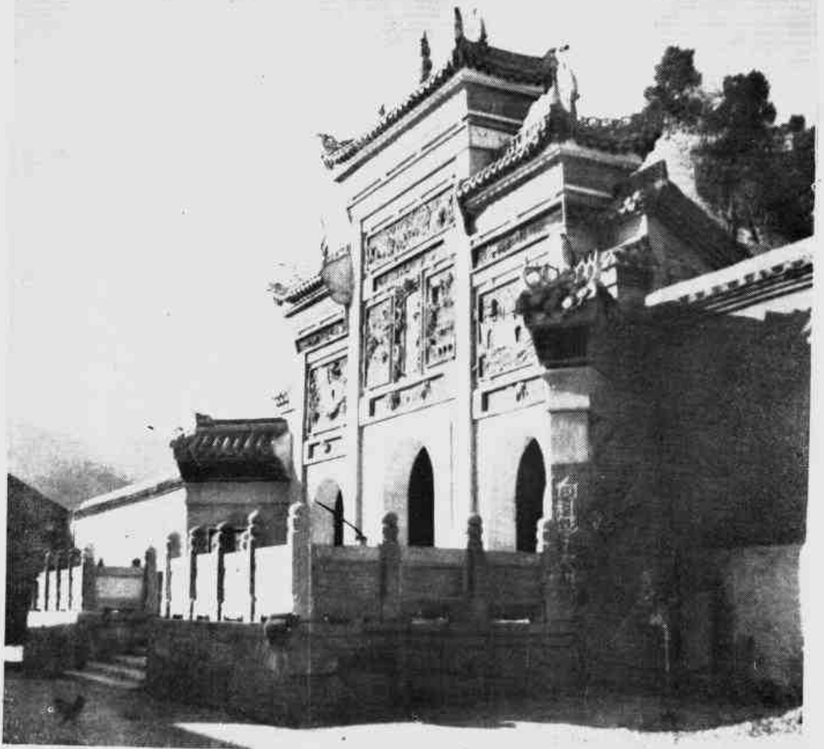
祝 圣 寺