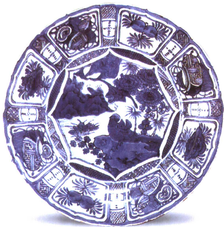
图9 青花水禽图克拉克瓷盘（明·万历）