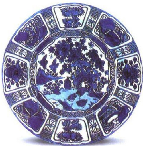
图8 青花水禽图克拉克瓷盘（明·天启） 口径51.5厘米 日本出光美术馆藏