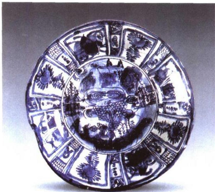
图 7 青花对奕图克拉克瓷盘（明·万历）口径 26 厘米

万历三十年到顺治十三年（1602-1656）销往荷兰的瓷器达 300 万件（平均每年 6 万件）；而雍正十二年（1734）一年销到荷兰东印度公司往返中国的船只就有 231 艘；来广州人员上千人次；带回货物有 6 类（茶叶、瓷器、生丝、纺织品、药品、杂类），而瓷器在所有货物中所占比重之大仅次于茶叶，居第二位。销往欧洲的瓷器有青花、五彩和广彩。这些瓷器中有纯中国风格的产品，有为适应欧洲生活风俗和审美习惯而烧制的西方风格产品，亦有中西风格融为一体的产品（如大多数青花“克拉克瓷”）。