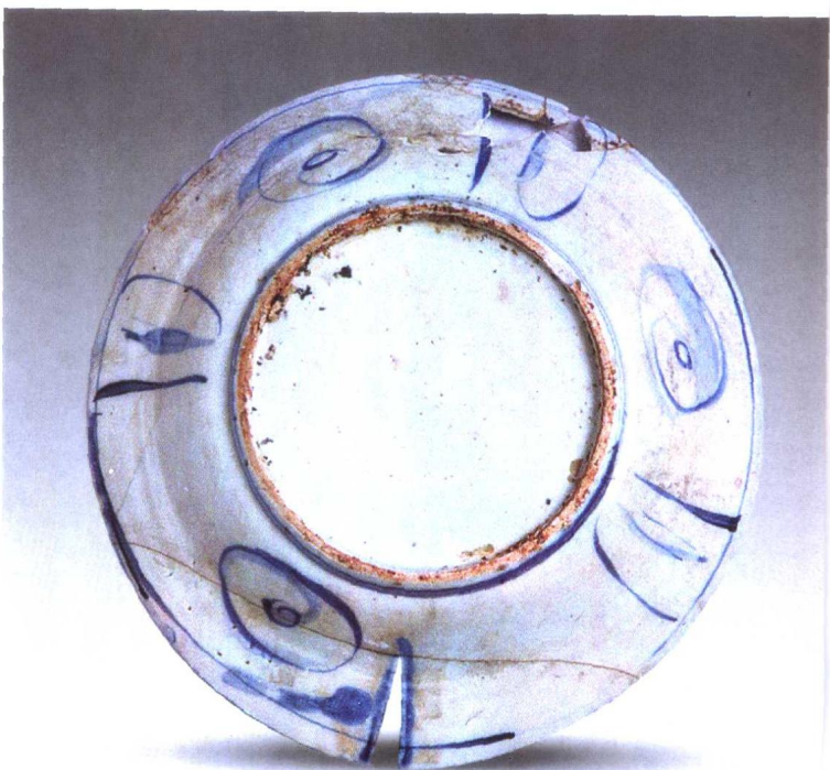
图5 青花花鸟图克拉克瓷盘 (明末) 余光仁先生收藏