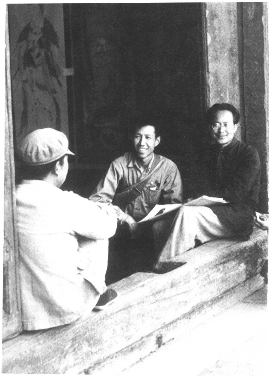
1951年作者与同事在陈列室门前休息时摄。当时正值北京历史博物馆午门楼上举办敦煌文物展，沈从文热心参与布展并经常充当说明员。