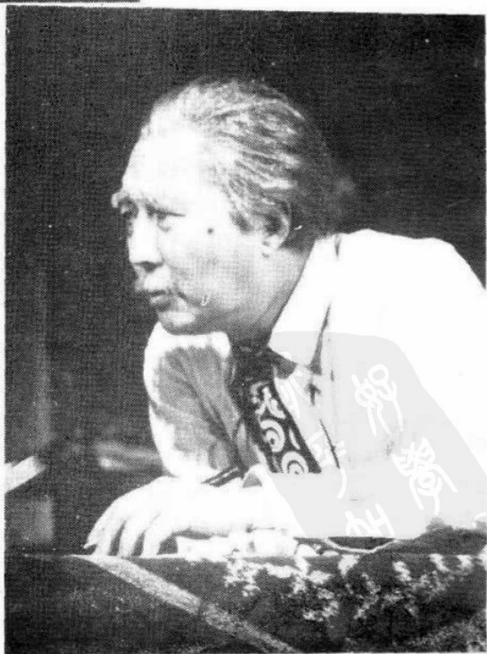
1985年在《洋 麻将》中饰魏勒。