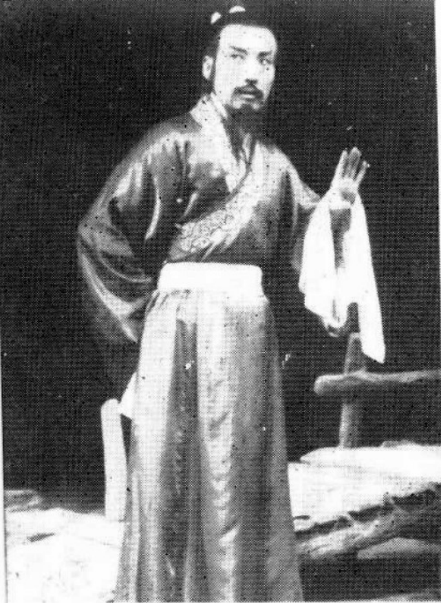
1956年在《耶 戈尔·布雷乔夫和 其他的人们》中饰 兹奉佐夫。