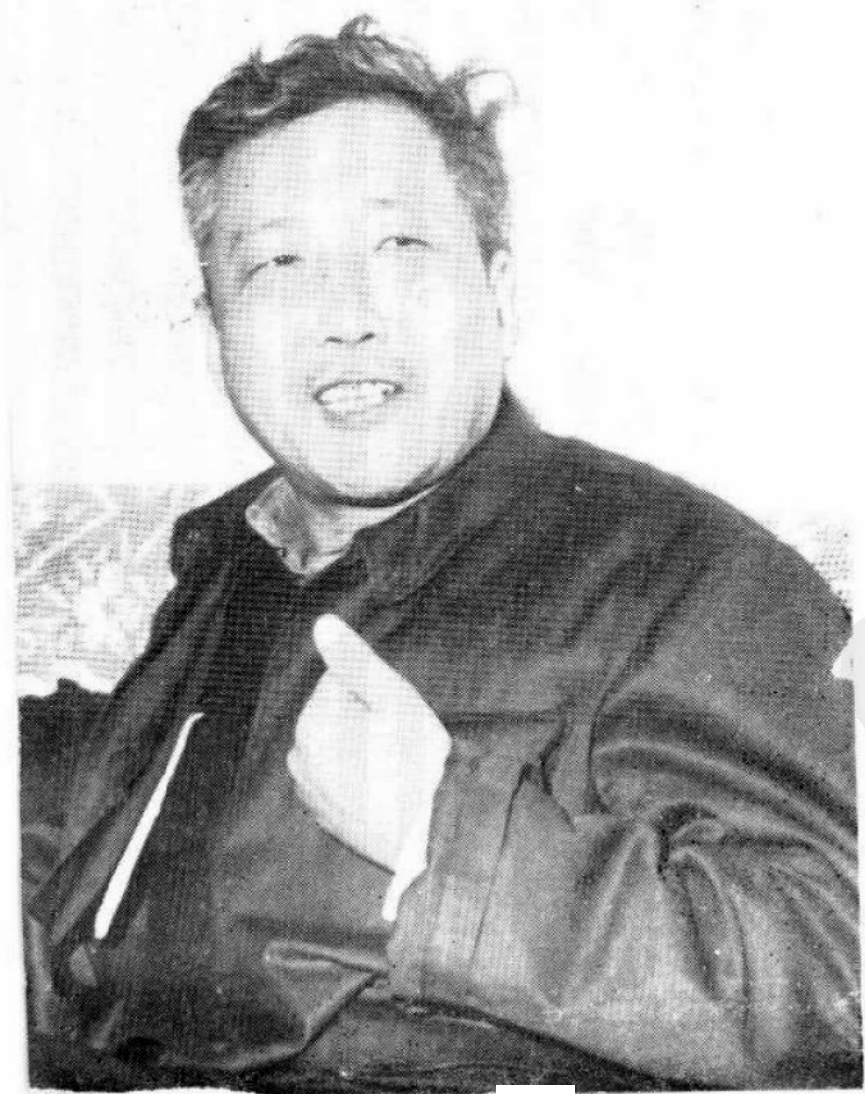
1980年，在一次座谈会上。