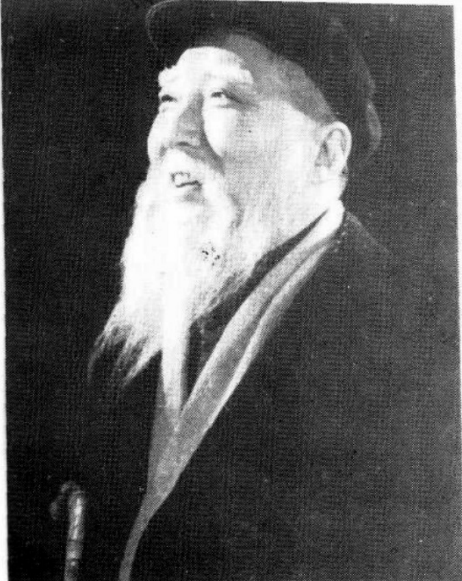
1978年在《丹心谱》 中饰丁文中。