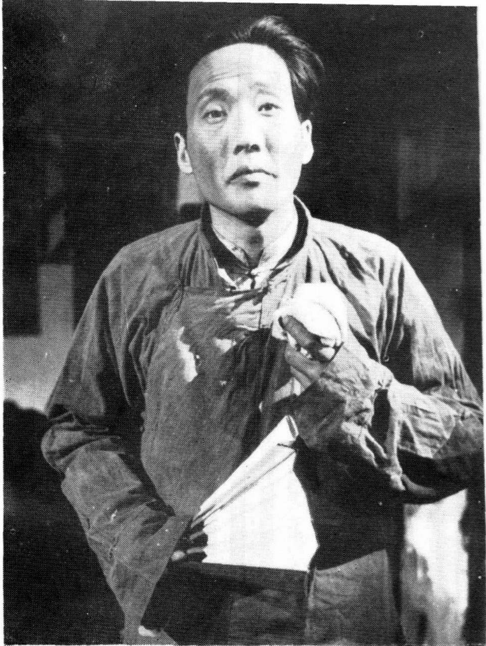
1951年在《龙须沟》中饰程疯子。