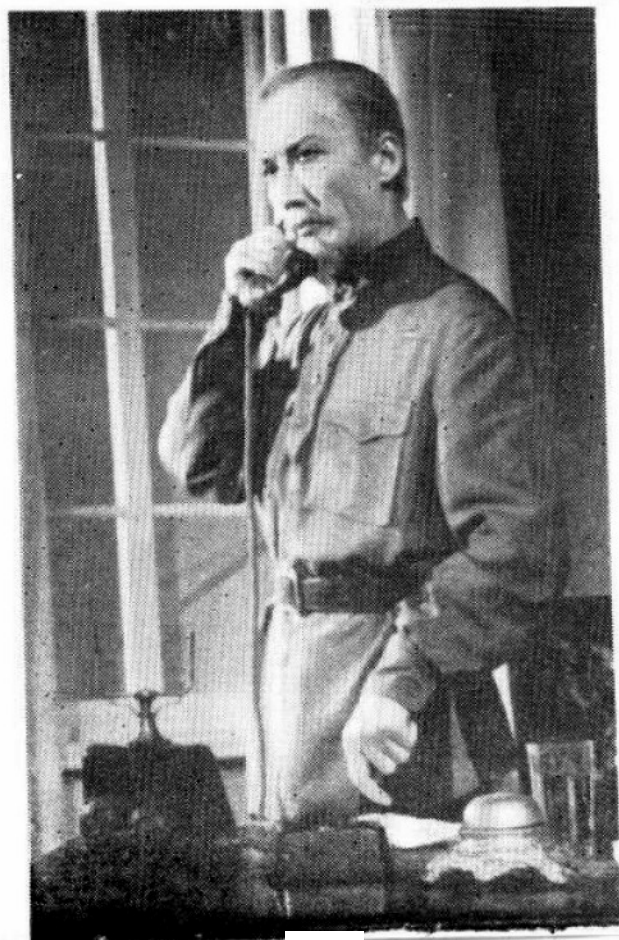
1962年在《以革命的名 义》中饰捷尔任斯基。