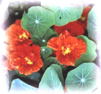
旱 金 莲