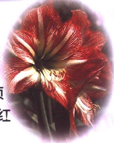
朱 顶 红