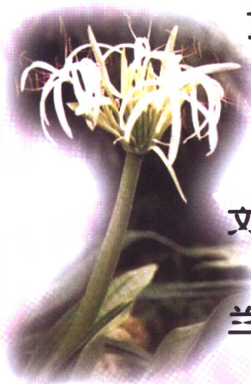
文 殊 兰