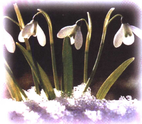
铃 兰 水 仙