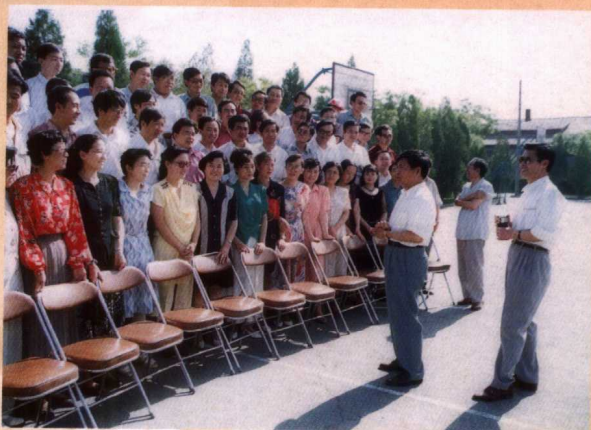
中共宁夏回族自治区副书记康义(左一)与 93级本科班毕业学员交谈并合影留念