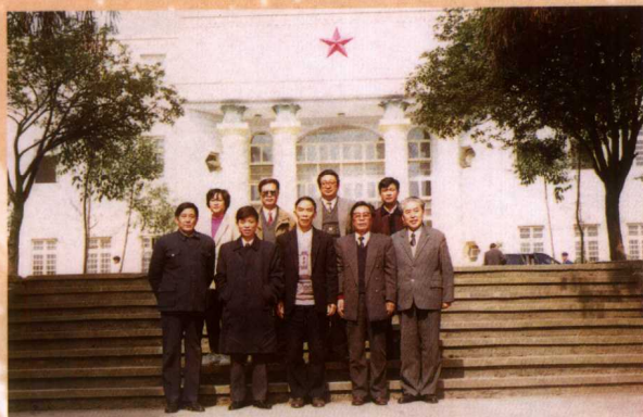
总院史信发等同志在遵义学区检查指 导工作时，与遵义地委党校和学区负责同 志合影