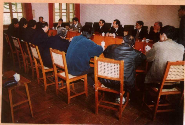
中共湖南省委党校、分院负责同志与省委干教处负责同志、学区负责同志共商函授教育发展大计