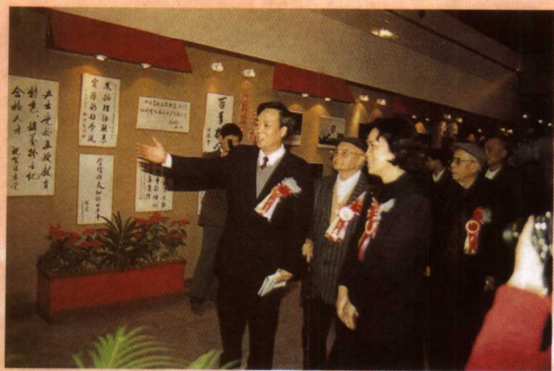
中共广东省委副书记张帼英、省人 大常委会主任林若、原省委书记任仲夷 等领导在省委党校常务副校长李本钧陪 同下参观函授教育展览