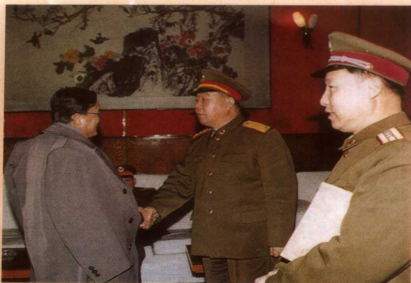
沈阳军区分院举行92级学员毕业典礼， 图为典礼前，沈阳军区司令员王克将军(中) 会见孙钱章同志