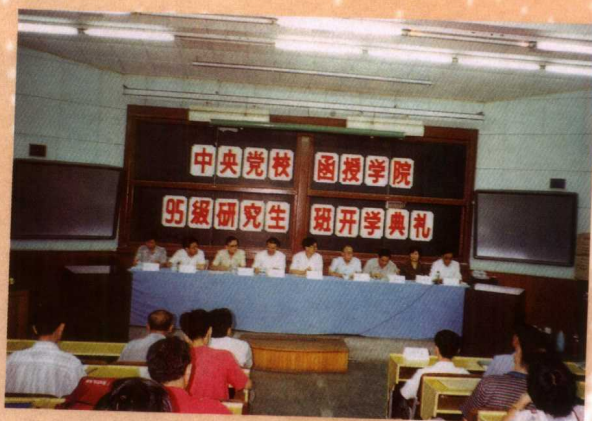
首届在职研究生班举行开学典礼，刘海藩副校长亲临祝贺并讲话 (总院研究生办 供稿)