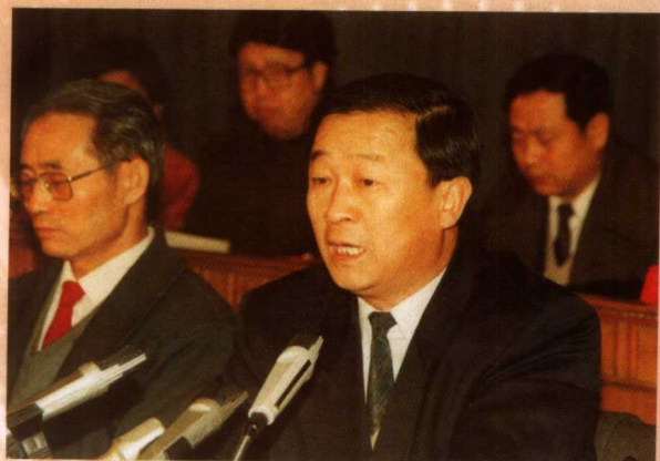
中共辽宁省委书记、省委党校校长王 怀远在辽宁省党校函授教育十周年庆祝大 会上讲话