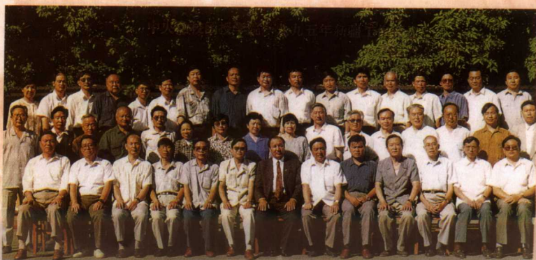
新疆维吾尔自治区主 席贾那布尔与总院暑期新 疆工作会议全体代表合影