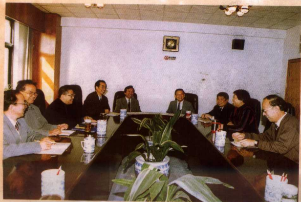
国家统计局党组听取分院负责同志 关于党校函授工作的汇报(右四为国家统 计局局长张塞)