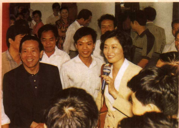
广西壮族自治区主席成克杰、中央电视台 记者敬一丹与南宁分院学员交谈