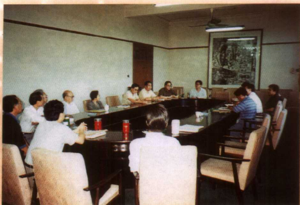
中共中央党校校委会在研究党校函授工作