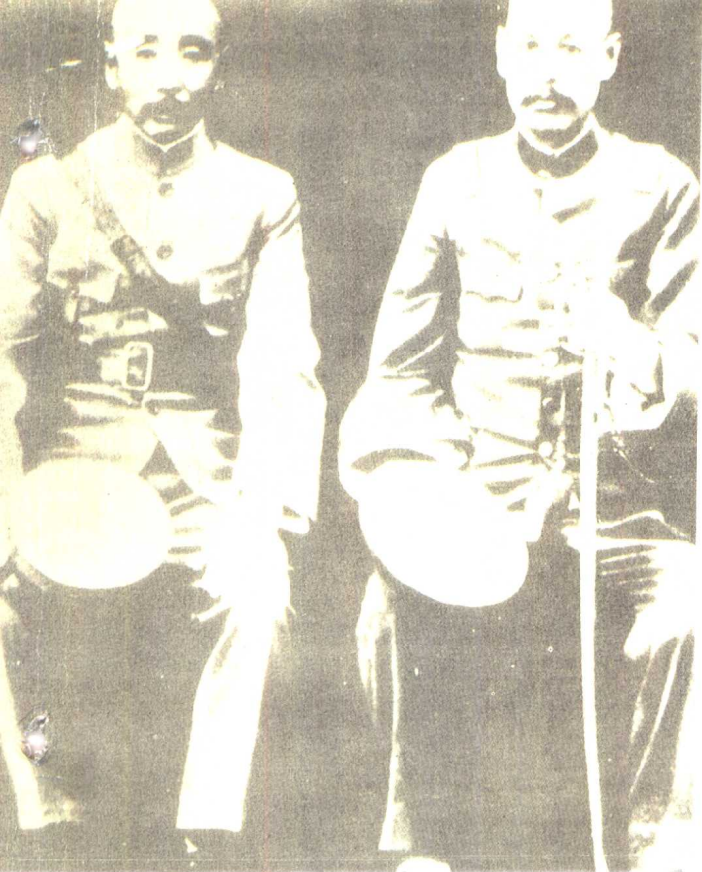
吴佩孚(右)和张作霖谁也不买谁的帐。