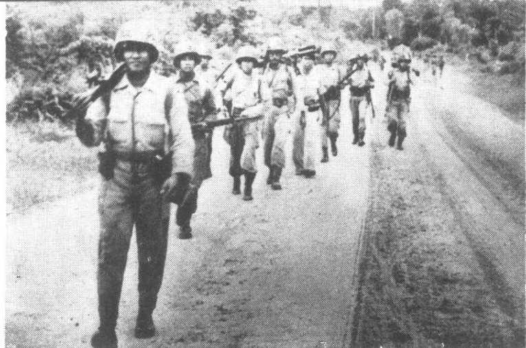
在中苏門答臘搜索叛軍的印度尼西亞政府軍