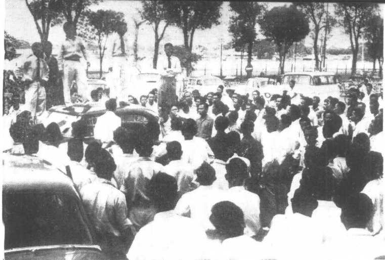
印度尼西亞的工人代表在接管了荷蘭皇家輪船公司后，向工人們發表談話。