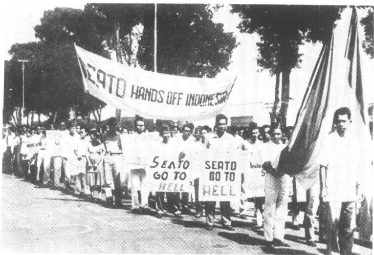
雅加達青年1958年3月25日舉行遊行示威，抗議美國和東南亞條約組織干涉印度尼西亞內政。