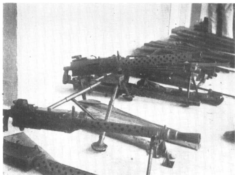
印度尼西亞政府軍繳獲的外國空投的美制武器