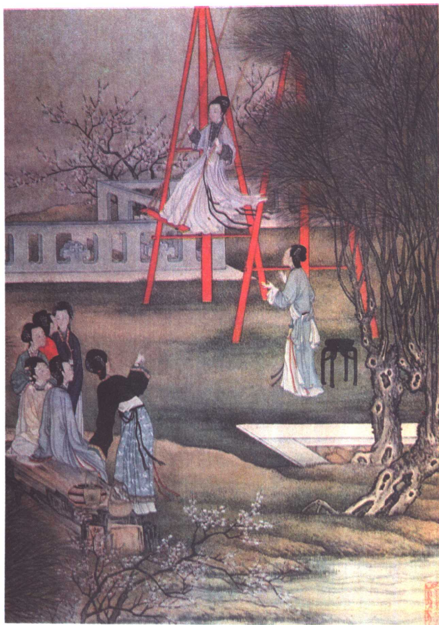
月曼清游园 [清] 陈枚