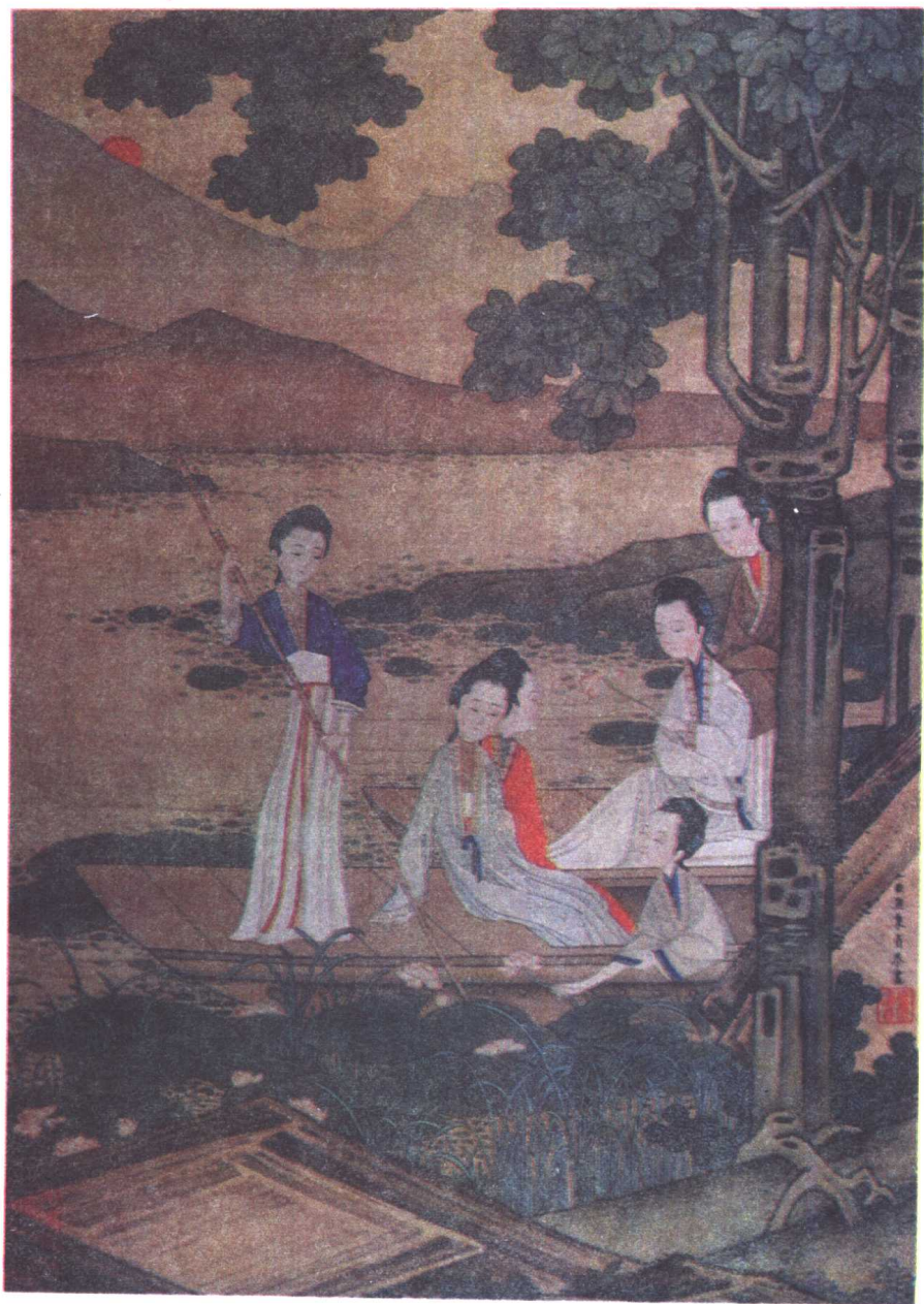
仕女图 [清] 焦秉贞