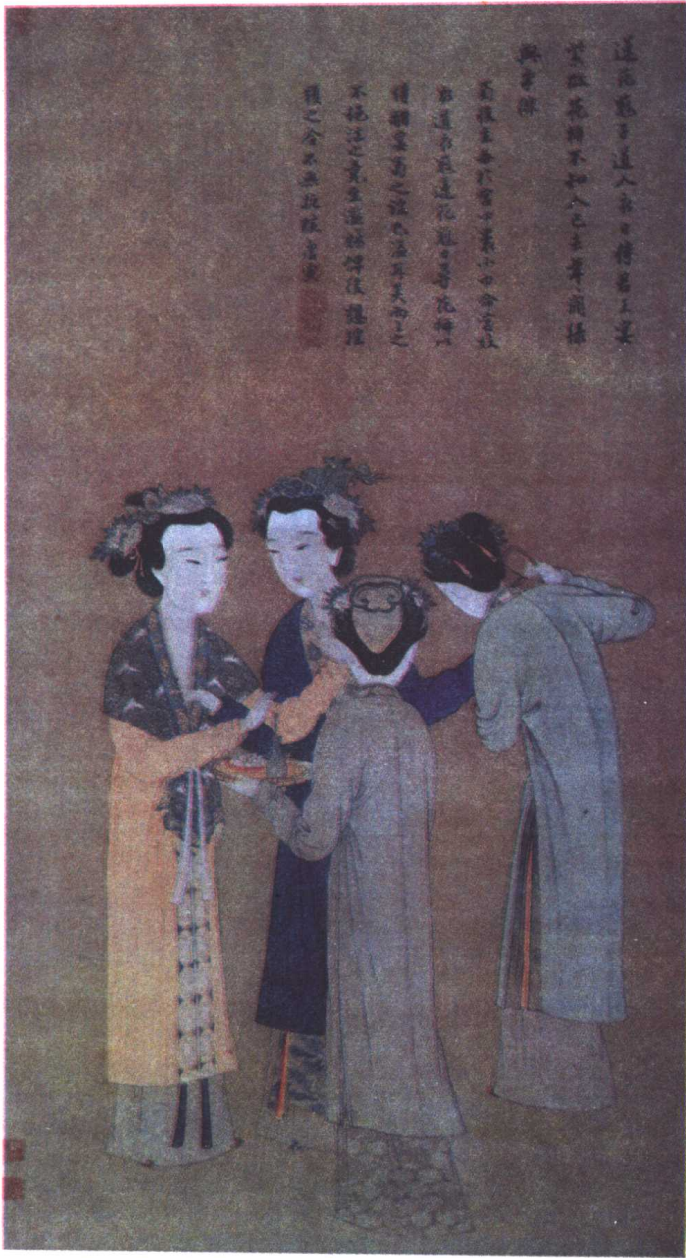
孟蜀宫妓图 [明] 唐寅