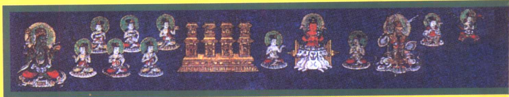
外金刚部院 - 东方(金刚峰寺版)