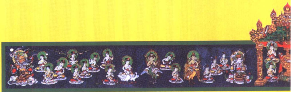
外金刚部院 - 西方(金刚峰寺版)