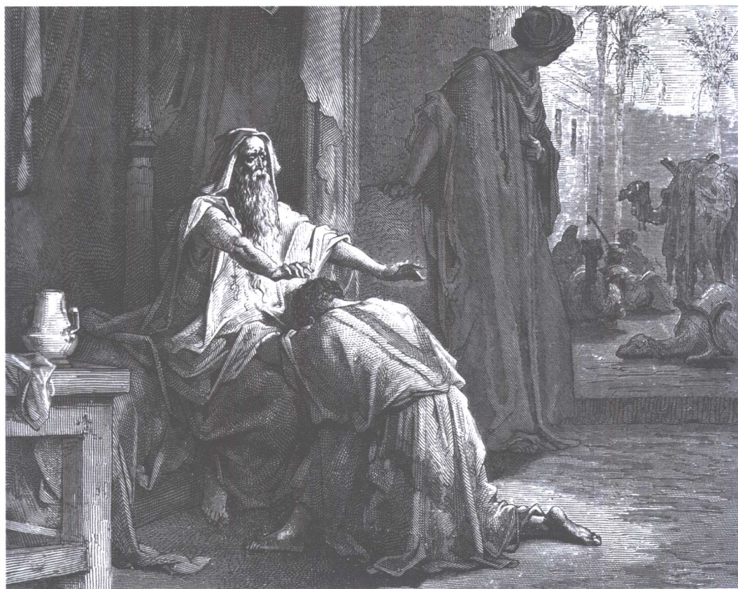
插图 古斯塔夫·多雷 编译 张延风

230 illustration de Gustave Doré avec des extraits du Nouveau et l'Ancien Testament choisis dans la Bible de Jérusalem