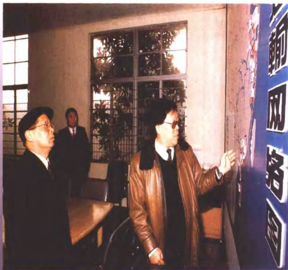
▲ 图为黄镇东部长在听取全国劳模 包起帆汇报

In the picture, Huang Zhenlong, Chinese Minister of Communications is being briefed by Bao Qifan, the national model worker.