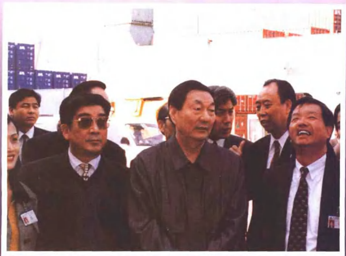
▲ 朱鎔基總理視察蘇州港國際集裝箱碼頭

Premier Zhu Rongji (center) inspection visit to Yantian International Container Terminal Co., Ltd. in Suzhou.