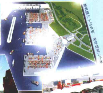
總面積六十五公頃 海岸線長三千米