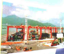
先進的機械設備及充裕的后動地