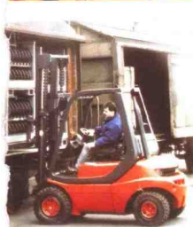
内燃平衡重式叉车