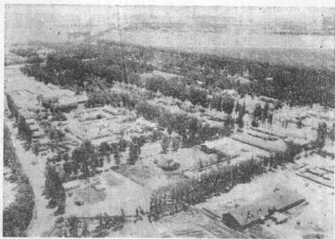
圖一 蘇聯國營農場的一角

但是它們之間是有區別的。國營農場的主人是國家、是全民。國營農場所有的財產及生產活