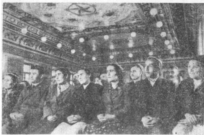
圖四 集體農莊莊員，在美麗舒適的俱樂部裏看戲

房子有四十五方丈大，裏面有兩間寢室，一間廚房，一條走廊，還有庫房和地窖。寢室內，地上鋪着地毯，牆上掛着壁氈和時鐘；睡的是鐵床，櫥、櫃、桌、椅、收音機、留聲機和電話機等等，一應俱全。他的書櫥裏有馬克思、恩格斯選集、列寧主義問題、斯大林傳略等書，還訂有「共產黨人」雜誌。他在工作隊擔任讀報和講解時事。在休息日，他們常到公園或到基洛夫巴德（城市名）去遊玩。