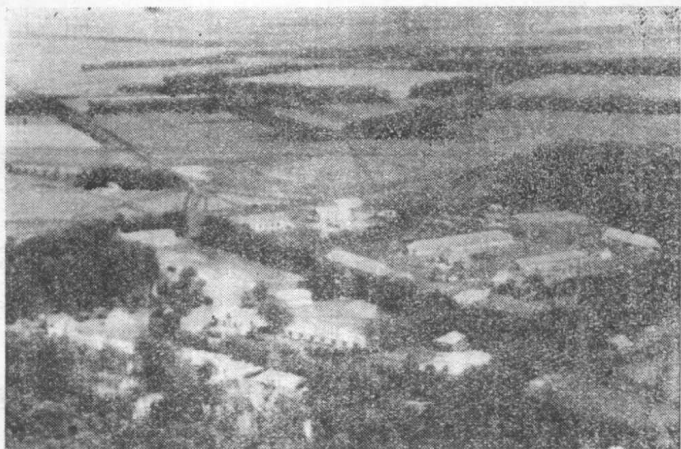
圖二 蘇聯集體農莊的一角