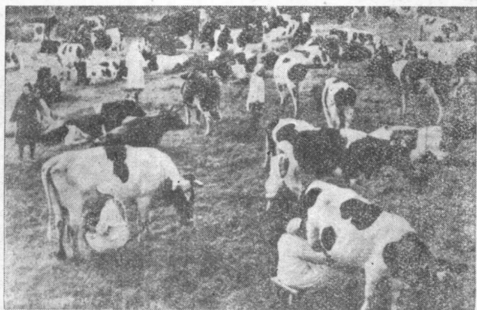
圖三 集體農莊的奶牛羣和在草場上擠奶情況