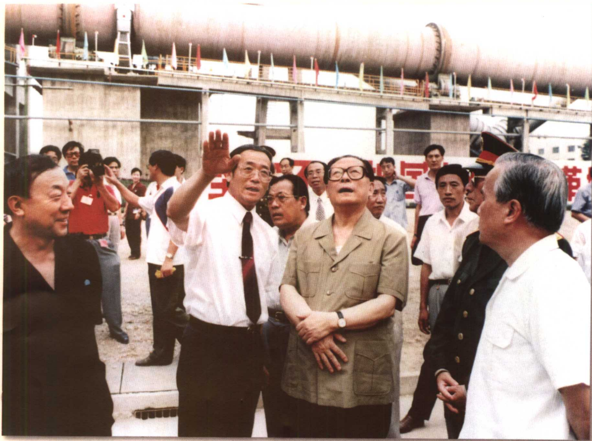
1996年7月江泽民同志视察冀东水泥厂，并为我国自行设计建造的第一条日产4000吨水泥熟料生产线投产点火