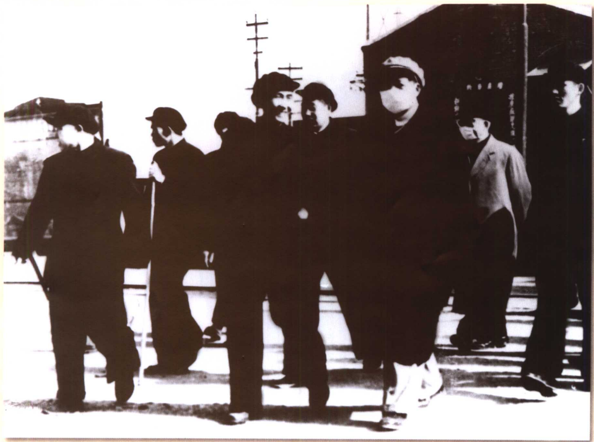
1954年4月毛泽东主席视察秦皇岛耀华玻璃厂