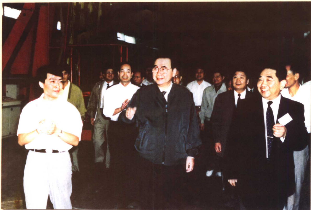
李鹏同志视察河南洛阳玻璃厂