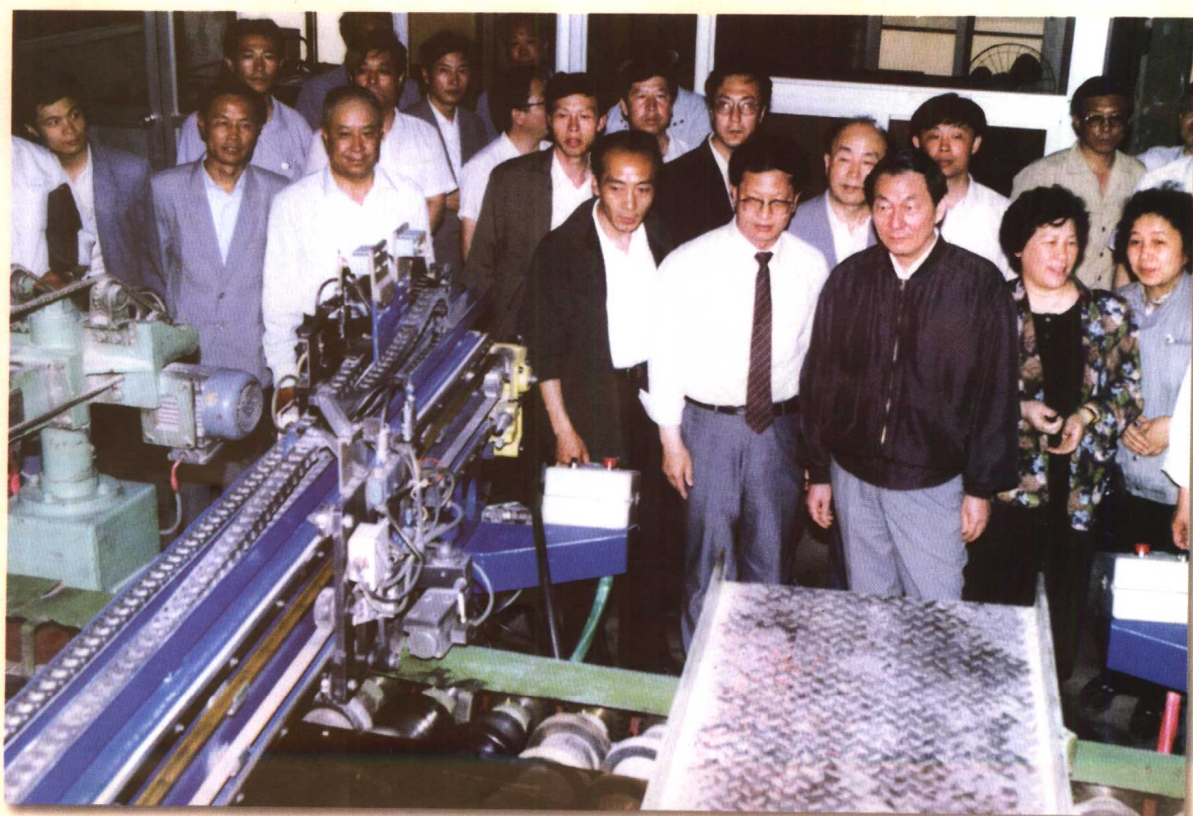
朱镕基同志视察中国秦皇岛耀华玻璃集团公司