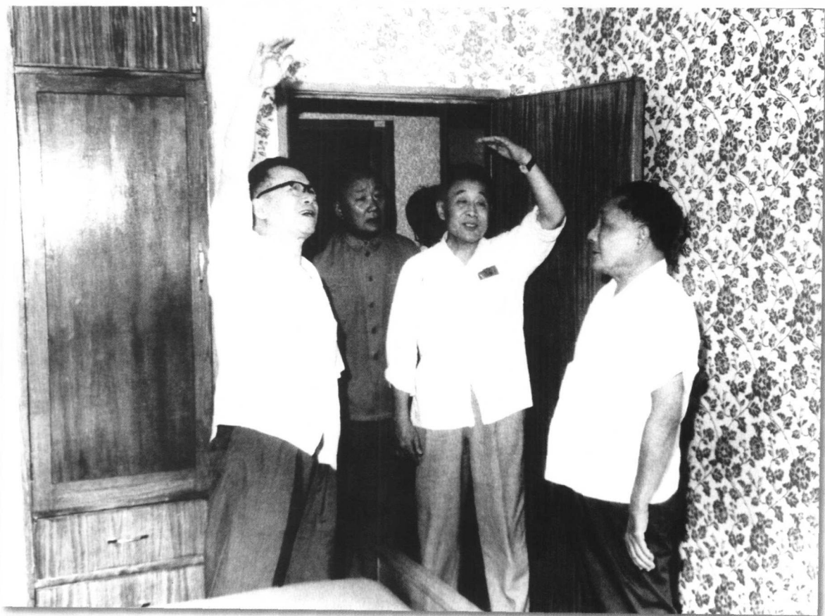
1979年8月邓小平同志视察北京紫竹院新型建材试验房