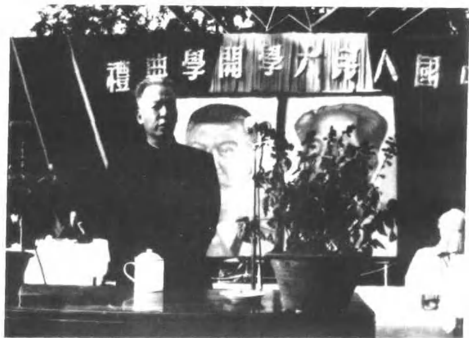
一九五〇年十月三日，刘少奇在中国人民大学开学典礼上讲话。