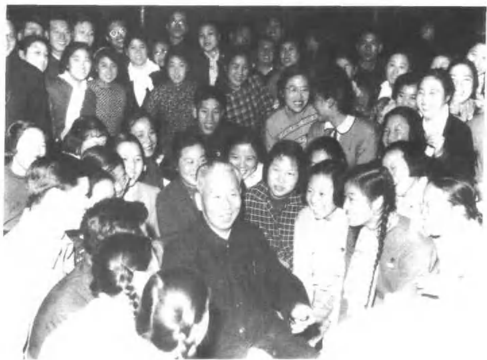
一九六〇年一月一日，刘少奇同参加新年联欢的 学生们在一起。