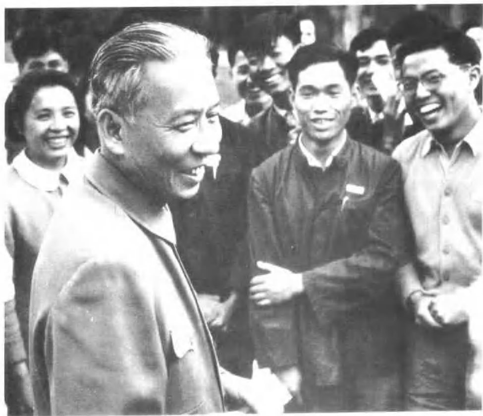
一九五七年五月十七日，刘少奇在中南海会见北京地质勘探学院应届毕业生代表。