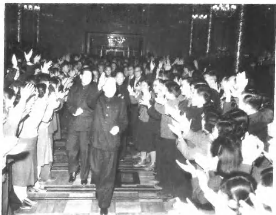
一九六〇年十二月一日,刘少奇率领中国党政代表团访问苏联时,在中国驻苏联大使馆会见中国留学生、实习生以及大使馆工作人员。