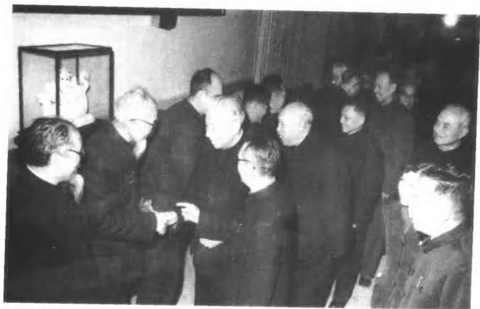
一九六三年一月二十六日，刘少奇等党和国家领导人出席全国科学技术协会举办的春节联欢会，向一百多位老科学家表示节日祝贺。