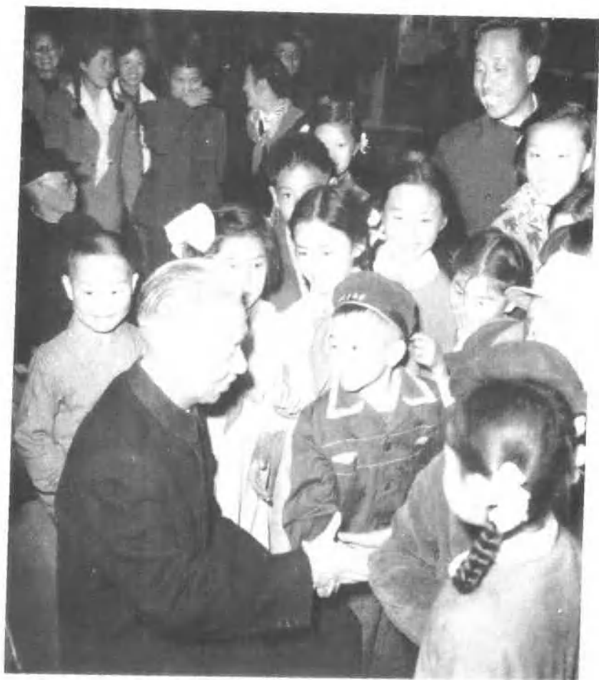
一九五九年五月，刘少奇同少年儿童在一起。