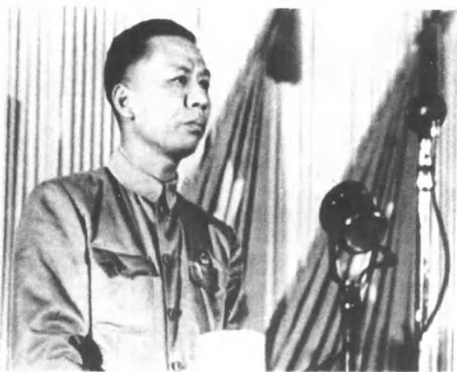
一九四九年九月二十一日，刘少奇代表中国共产党 在中国人民政治协商会议第一届全体会议上讲话。