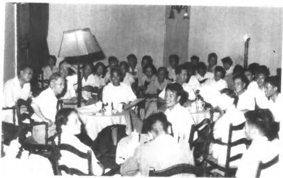
一九五八年七月，刘少奇在天津同试办半工半读的工厂的干部和教师代表座谈。