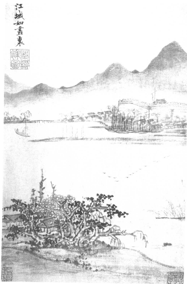
[明] 项圣谟绘《秋登宣城谢朓北楼》