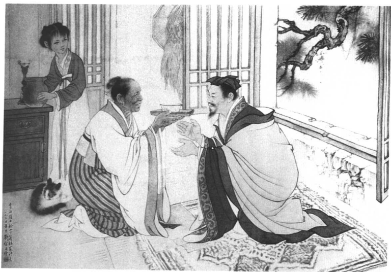
刘继卣绘《宿五松山下荀媪家》