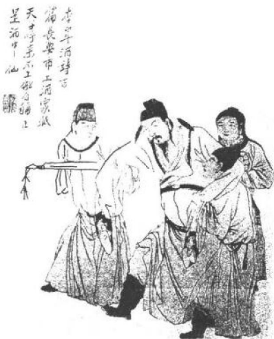
[明]李流芳绘《饮中八仙歌》

事,后来汇为一个不朽的称号——诗仙。然而一切神仙都有着人世的影像,“诗仙李白”的背后,同样有着丰厚的历史、时代的文化内涵。