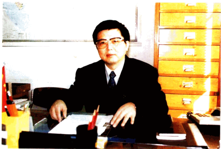
华东师范大学党委书记陆炳炎研究员