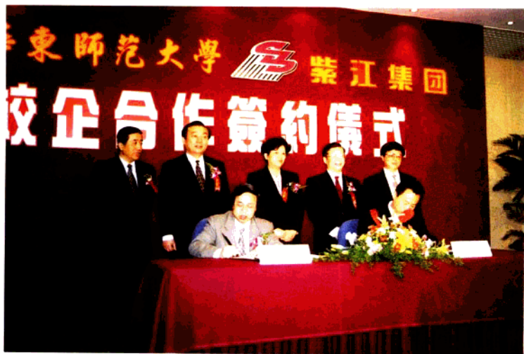
华东师范大学和上海紫江集团校企合作签约仪式