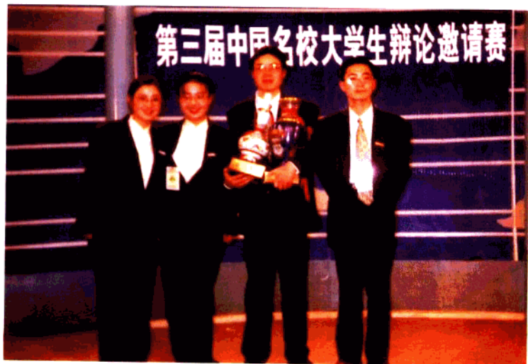
华东师范大学辩论队在第三届中国名校大学生辩论赛上荣获冠军