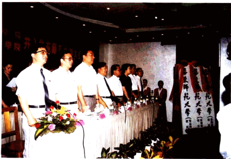
上海教育学院、上海第二教育学院并入华东师范大学