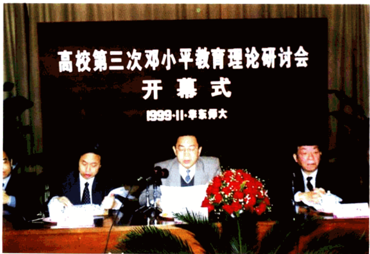
全国高校邓小平理论研究会在华东师范大学召开