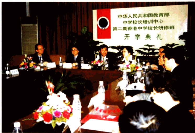
教育部华东师范大学中学校长培训中心香港中学校长研修班开学典礼