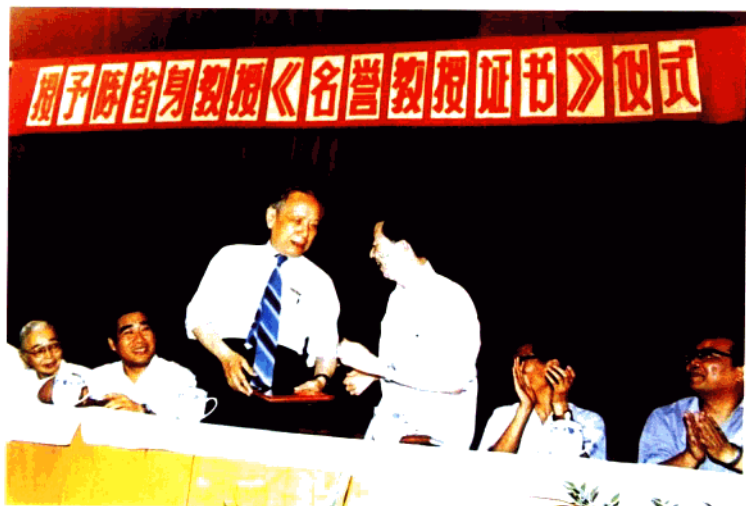
授予陈省身教授华东师范大学名誉教授证书仪式