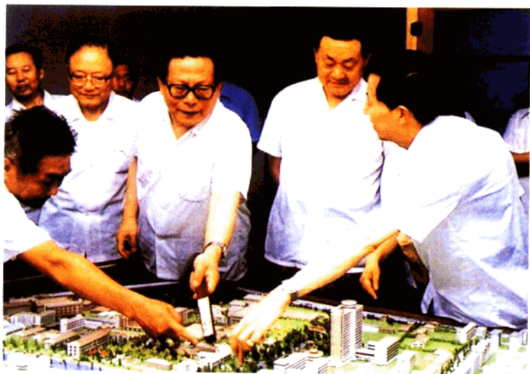
江泽民同志视察华东师范大学