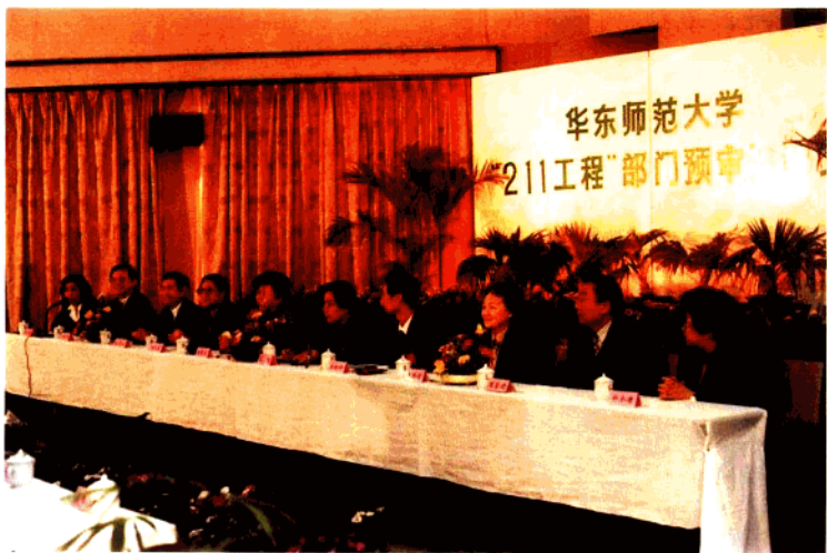
华东师范大学顺利通过“211工程”部门预审