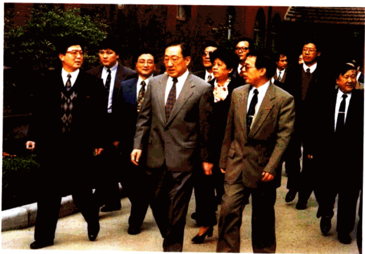
李岚清同志视察华东师范大学