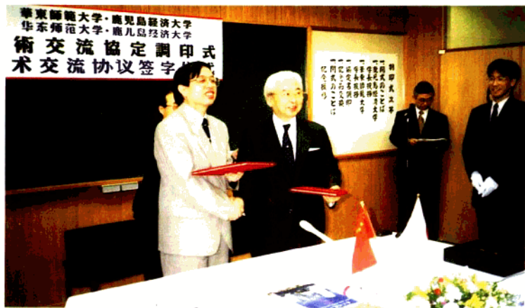
华东师范大学和日本鹿儿岛经济大学合作签约仪式