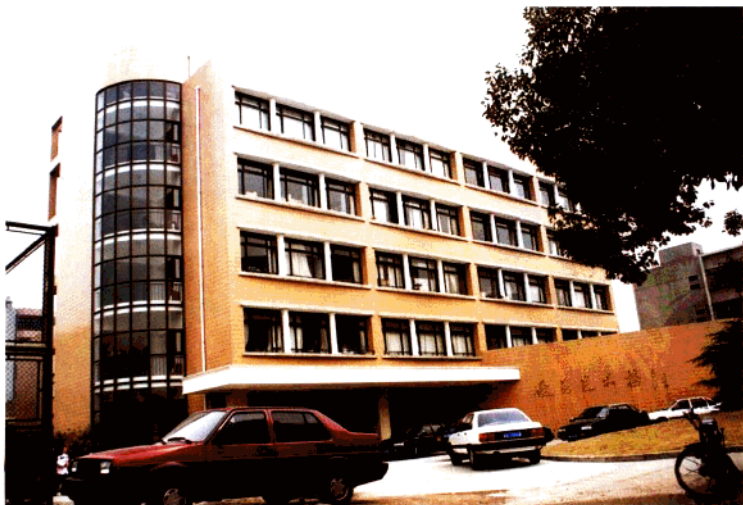
由新加坡华侨捐资建设的俊秀艺术楼