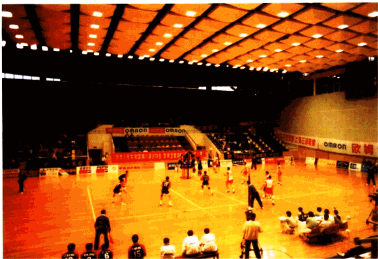
全国八运会排球比赛场馆华东师范大学体育馆