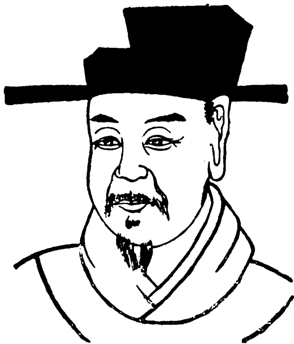
杨万里画像 (江西省吉水县文化馆供稿)