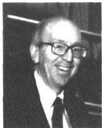
Richard A. Posner

波斯纳（1939年-），先后以第一名毕业于耶鲁大学文学系（1959）和哈佛法学院（1962）。曾任联邦最高法院大法官助手、政府律师、斯坦福大学法学院副教授、芝加哥大学法学院教授和讲座教授。1981年出任联邦第七巡回区上诉法院法官至今（1993-2000年任首席法官），同时担任芝加哥大学法学院高级讲师。