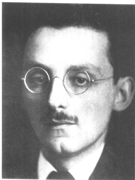
卡夫卡的挚友马克斯·布罗德