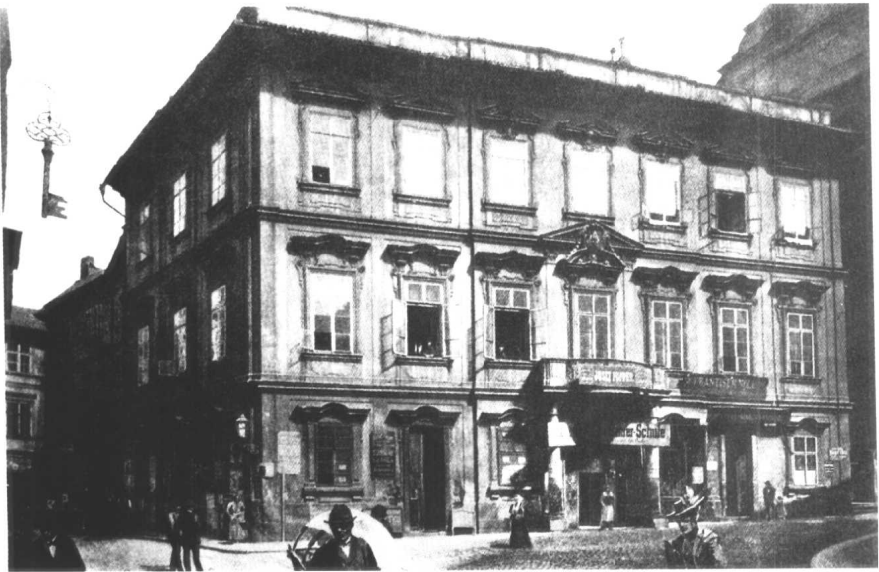
卡夫卡于1883年7月3日生于此楼(布拉格)