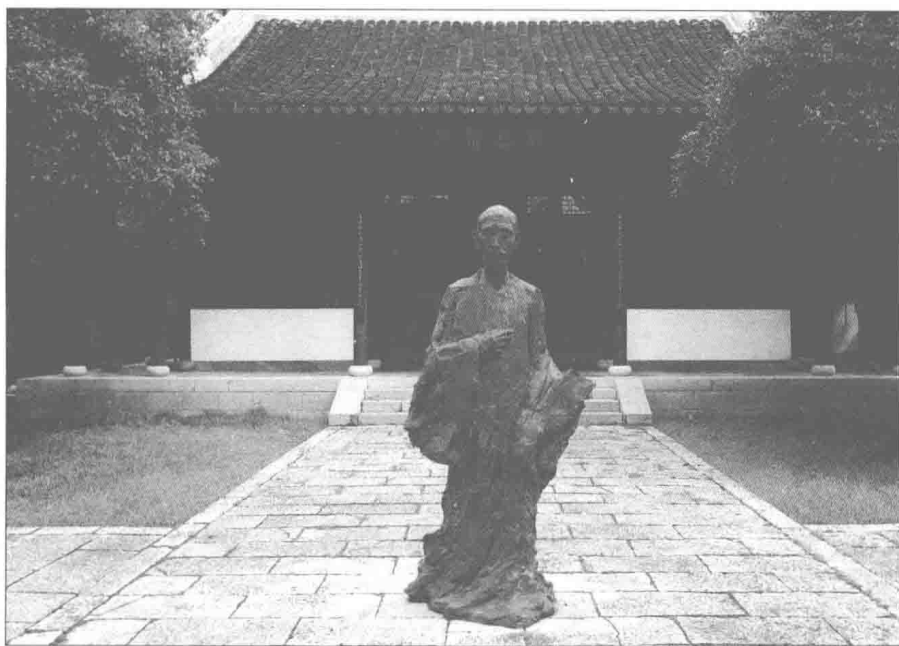
段玉裁紀念館