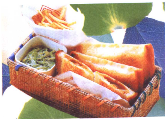
袋装咖喱夹心三明治