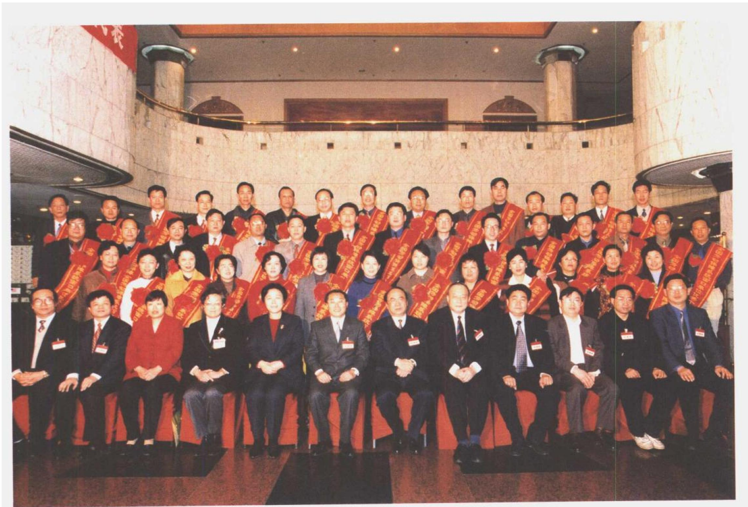
图为劳动保障部领导与在全国劳动和社会保障工作会议上受表彰的全国劳动保障系统“三优”文明窗口单位代表、窗口单位优秀个人合影。