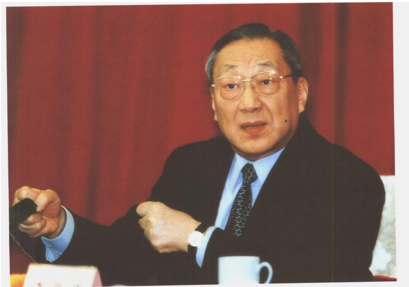
图为中共中央政治局常委、国务院副总理李岚清主持12月27日的闭幕会。