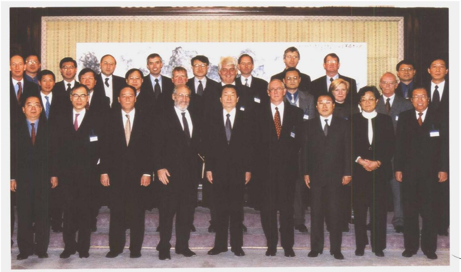
2000年12月17日至18日，劳动保障部和国务院体改办在京联合举办中国社会保障体系改革国际研讨会。国务院总理朱镕基接见了前来参加此次研讨会的一部分外国专家，并就完善城镇社会保障体系试点方案进一步听取了专家的意见。图为朱镕基总理与专家们合影。