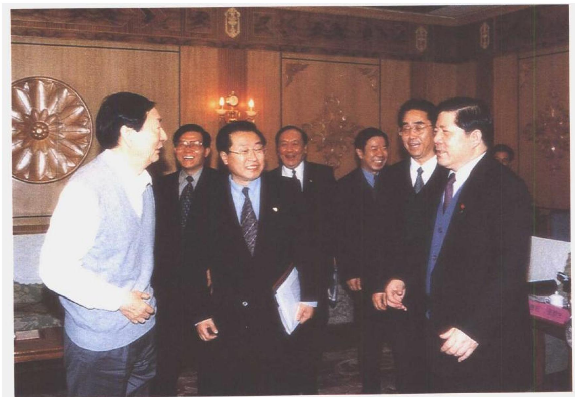
2000年2月21日至24日，国务院总理朱镕基在河北省唐山市考察工作时，在社会保障体系建设和国有企业改革座谈会上强调，要高度重视并采取切实有力措施，加快推进社会保障体系建设。图为朱镕基总理与河北省及唐山市领导亲切交谈。