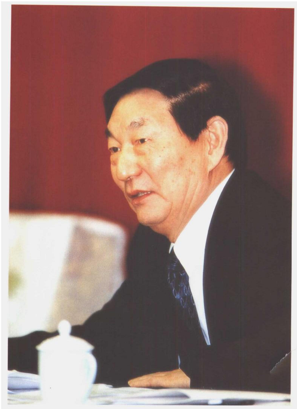
2000年12月26日至27日，国务院在北京召开全国社会保障工作会议，总结1998年5月以来的社会保障工作，研究贯彻《关于完善城镇社会保障体系的试点方案》的政策措施，部署2001年和今后一个时期的社会保障工作。图为中共中央政治局常委、国务院总理朱镕基出席会议并作重要讲话。