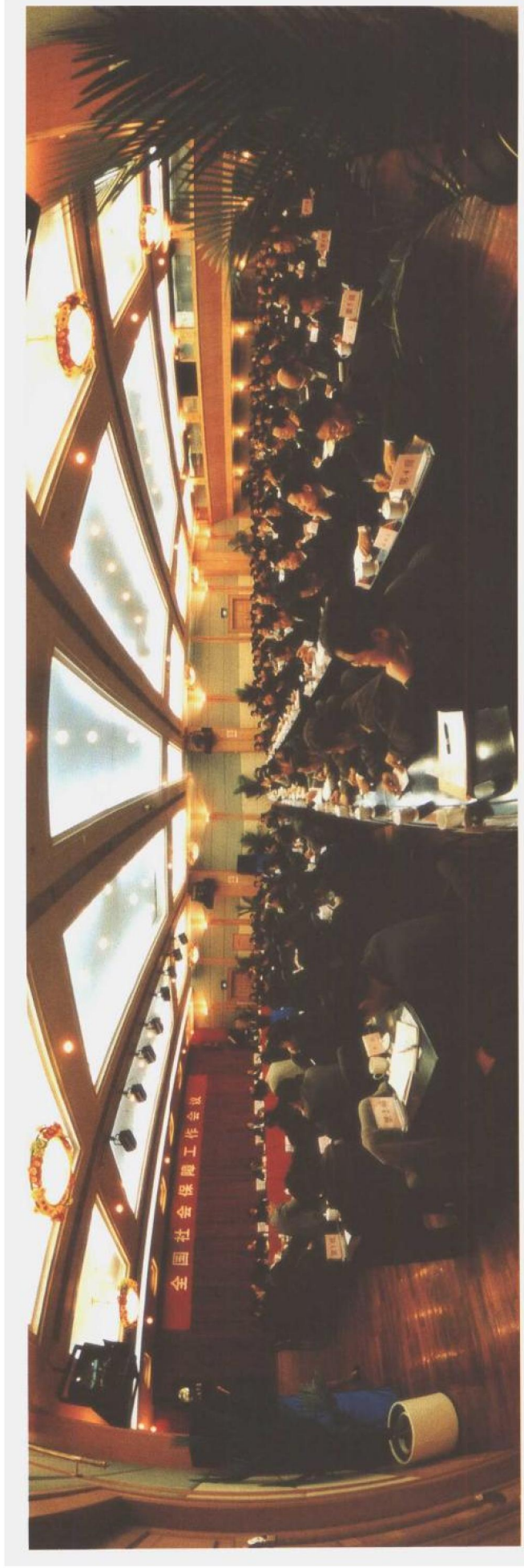
图为全国社会保障工作会议场景。各省、自治区、直辖市和计划单列市、新疆生产建设兵团分管劳动保障工作的负责同志，劳动保障、财政、民政部门的负责人，党中央、国务院有关部门和单位的负责同志参加了会议。