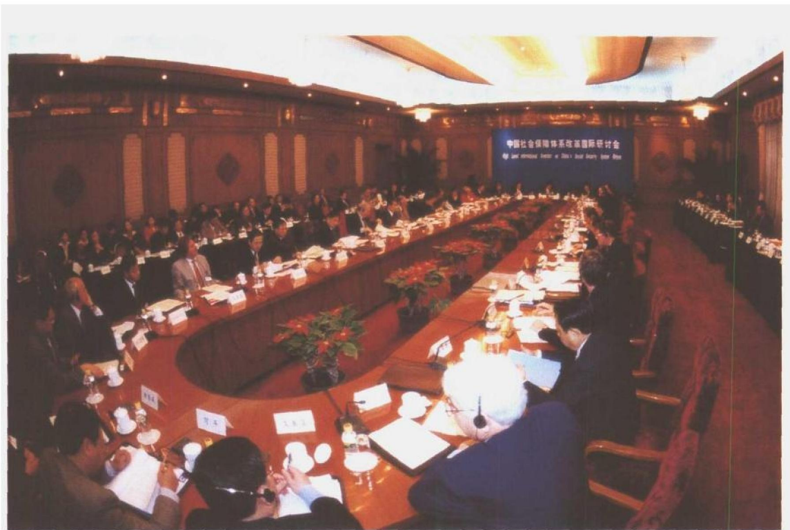
图为中国社会保障体系改革国际研讨会场景。