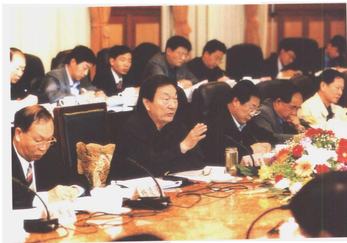
2000年4月19日至27日，国务院总理朱镕基在辽宁就国有企业改革和社会保障体系建设问题进行调查研究。朱镕基强调，一个独立于企业事业单位之外的社会保障体系，是社会主义市场经济体制的重要支柱。加快建设这个体系，是深化改革、稳定社会、治国安邦的根本大计，一定要把这件关系全局的大事办好。