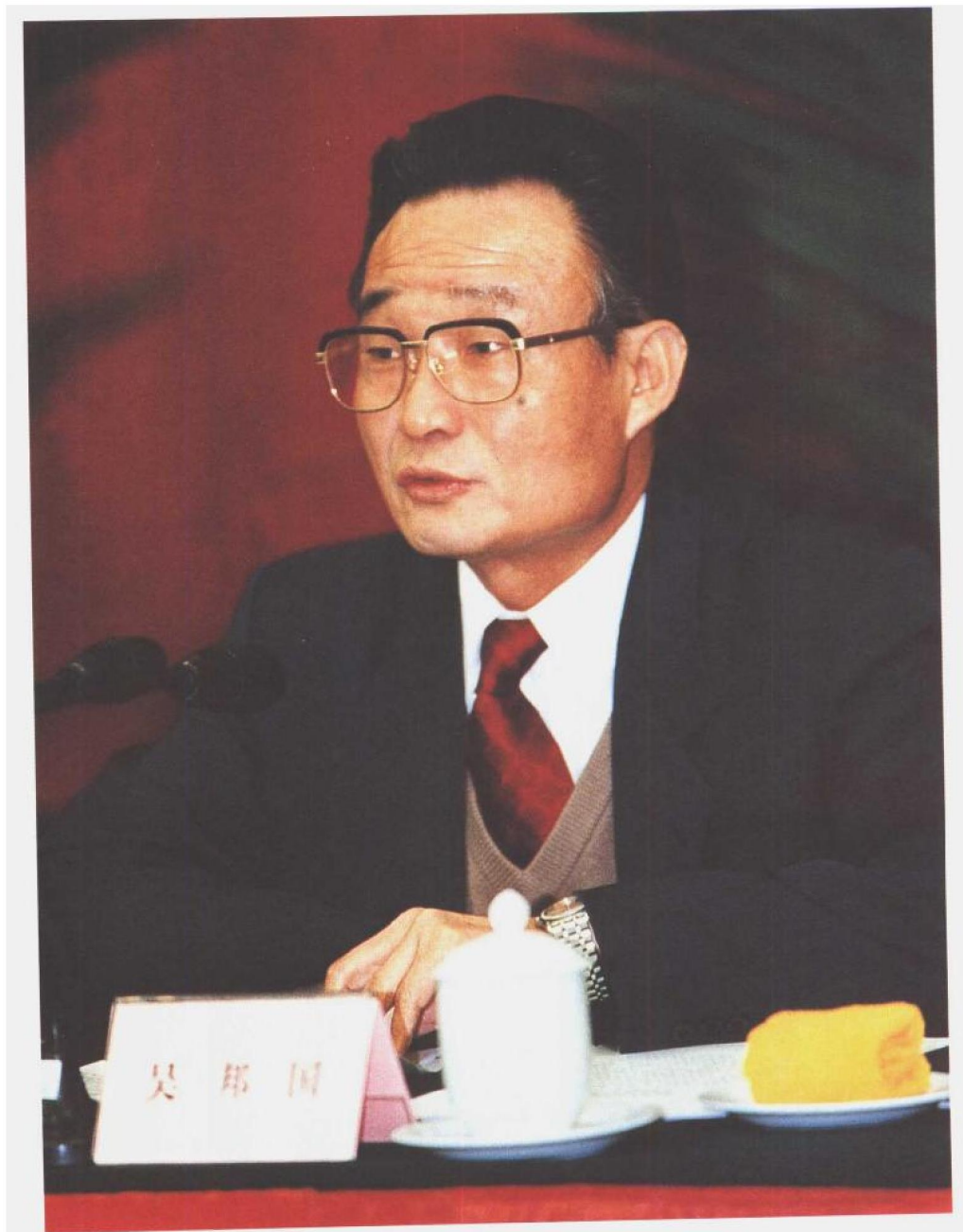
图为中共中央政治局委员、国务院副总理吴邦国在全国社会保障工作会议12月26日开幕会上讲话。国务委员兼国务院秘书长王忠禹主持了开幕会，国务委员司马义·艾买提出席会议。