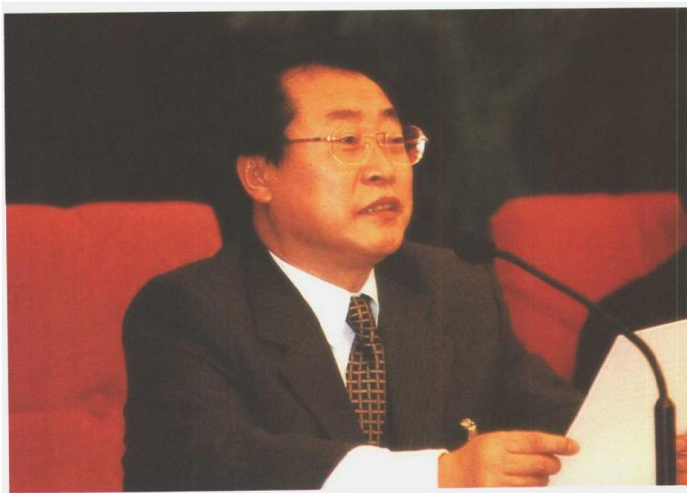
劳动保障部部长张左己在全国劳动保障工作会议暨先进集体先进个人表彰大会上讲话。