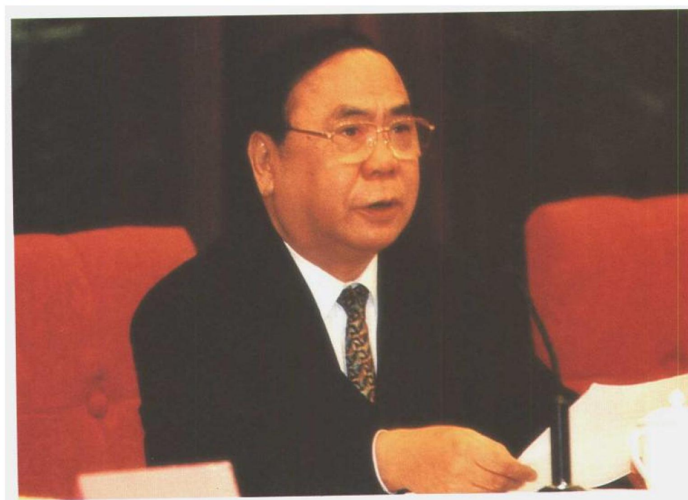
劳动保障部副部长李其炎主持全国劳动保障工作会议暨先进集体先进个人表彰大会。