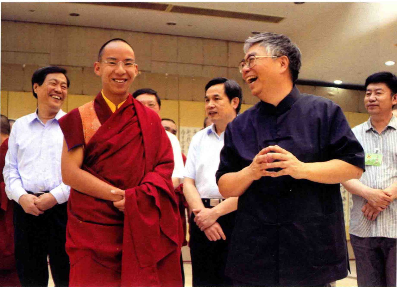
2012年，班禅大师在全国政协礼堂观看《辛亥革命人物赋》书法展览。