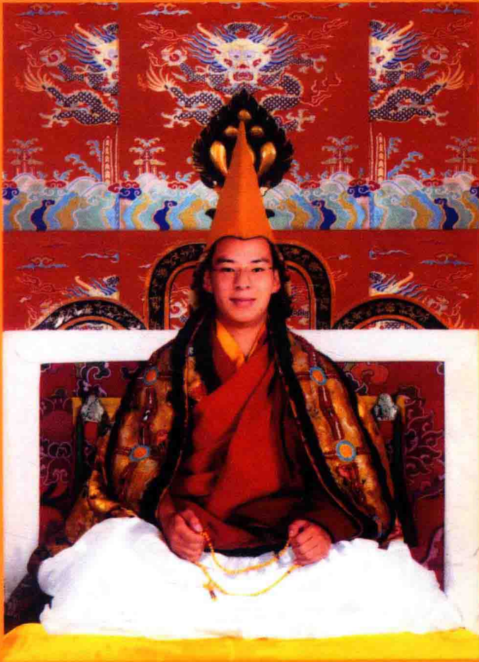
ལ་ བཅའ་རྒྱུ་མེད་ཉེན་རྩི་པུ་ལྷན་སྐོར་བཟང་ལྷན་སྐོར་བྱམས་པ་རྣམས་ཀྱི་རྒྱལ་པོ་དཔལ་བཟང་པོ། 班禅额尔德尼·吉尊洛桑强巴伦珠确吉杰布白桑布 པོ་དཔལ་བཟང་པོ་ལྷན་སྐོར་བྱམས་པ་རྣམས་ཀྱི་རྒྱལ་པོ་དཔལ་བཟང་པོ། 西藏扎什伦布寺