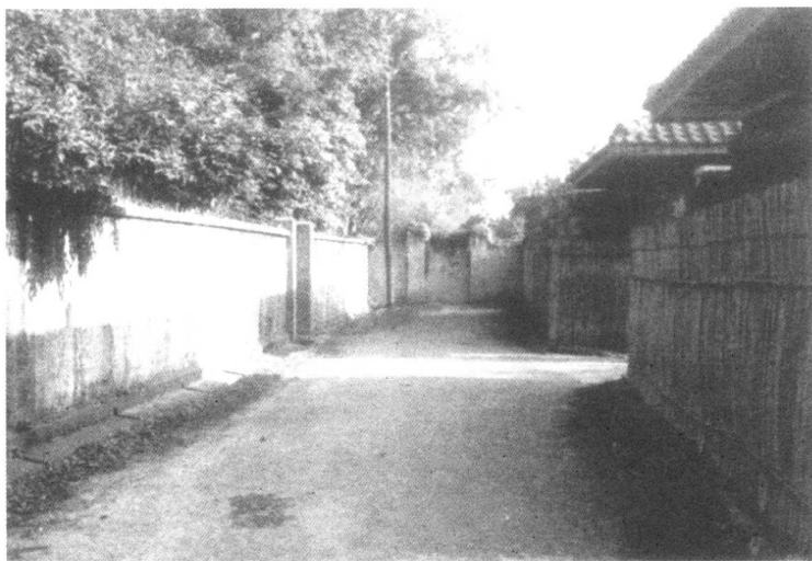
台北市温州街18巷16弄9号殷家(1956—1973)