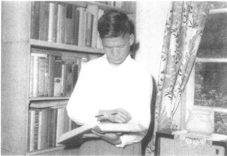
1962年，正在书房翻阅文献的殷海光