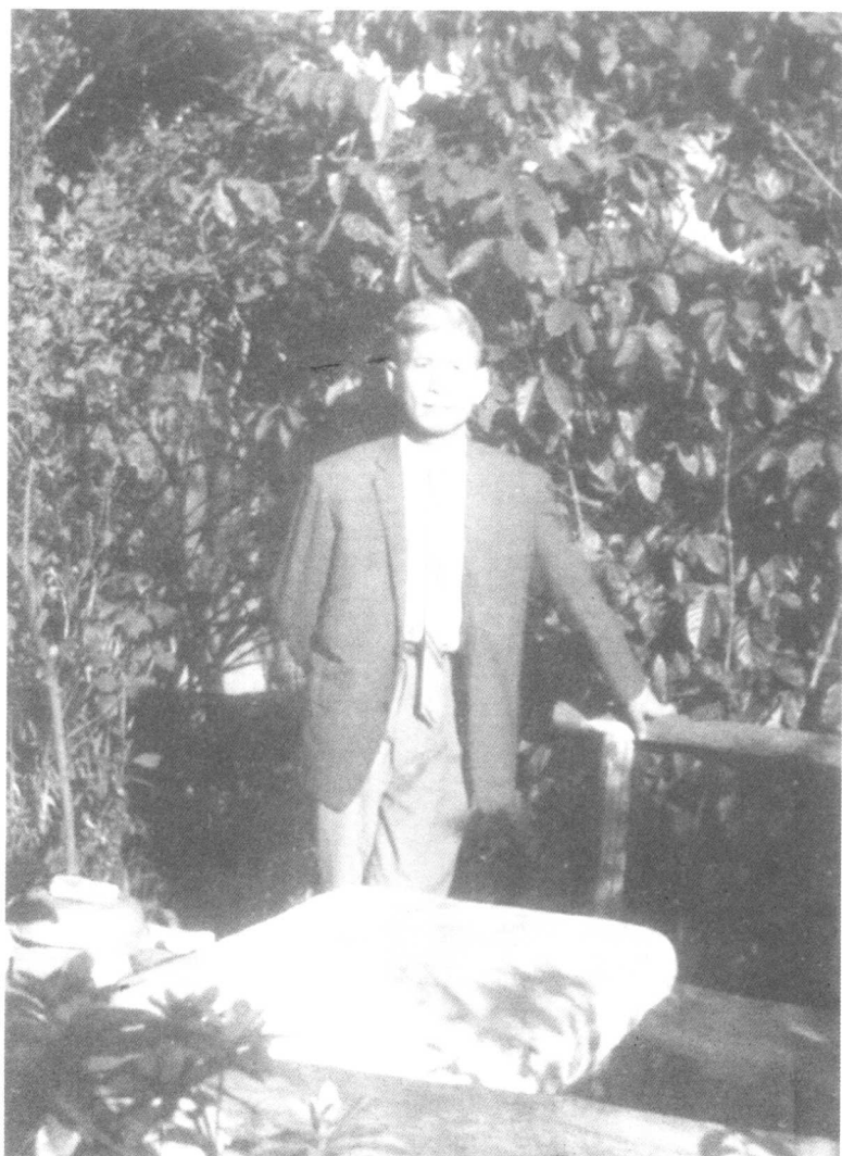
1968年，殷海光在自家院落里