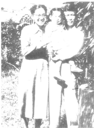
1957年，殷海光夫妇和女儿