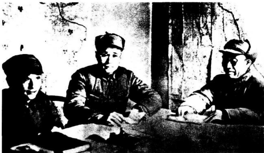
八路军总司令朱德与一二九师师长刘伯承、政委邓小平在一起。

1940年4月，一二九师领导与晋察冀军区司令员聂荣臻在山西辽县(今左权县)合影。