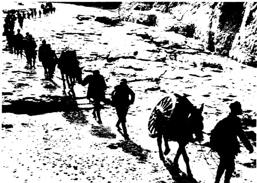
1938年冬，一二九师一部 行进在晋东南山地间。