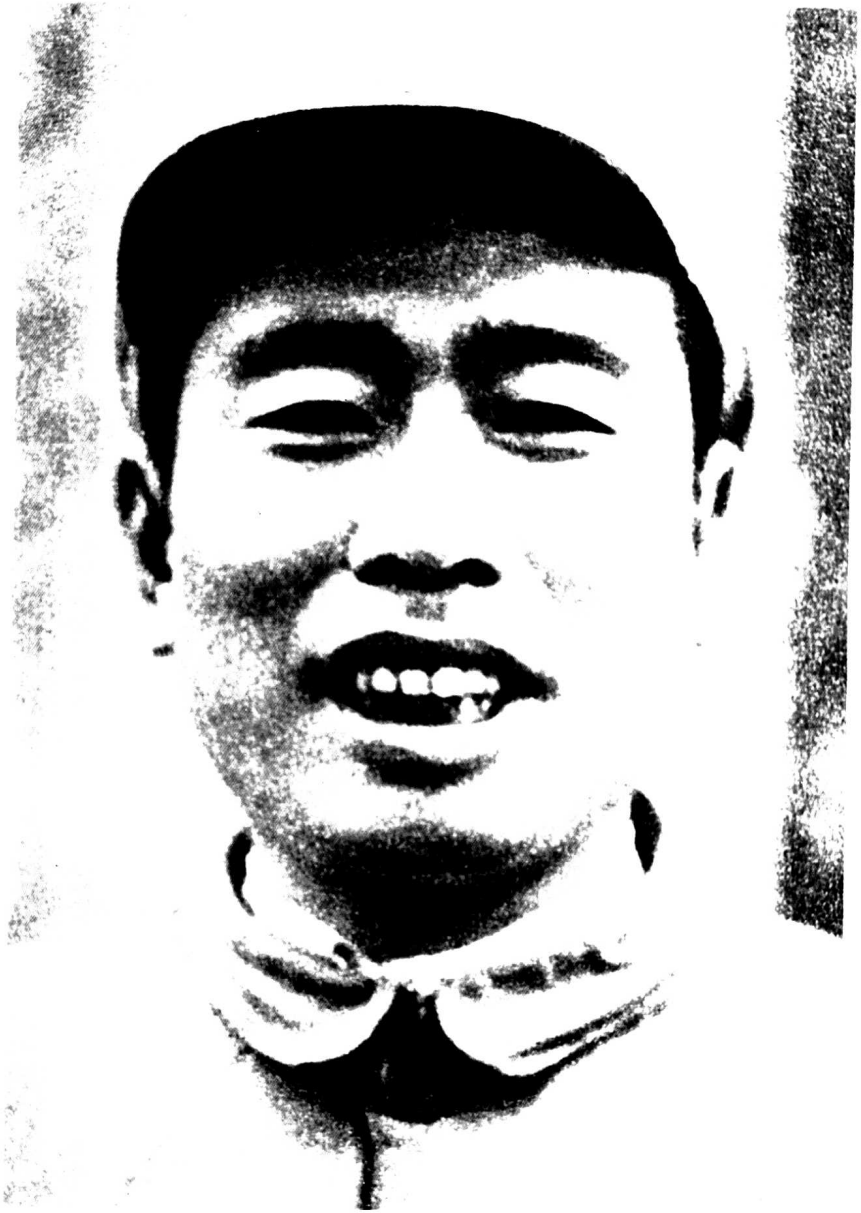
一二九师政治部主任宋任穷。