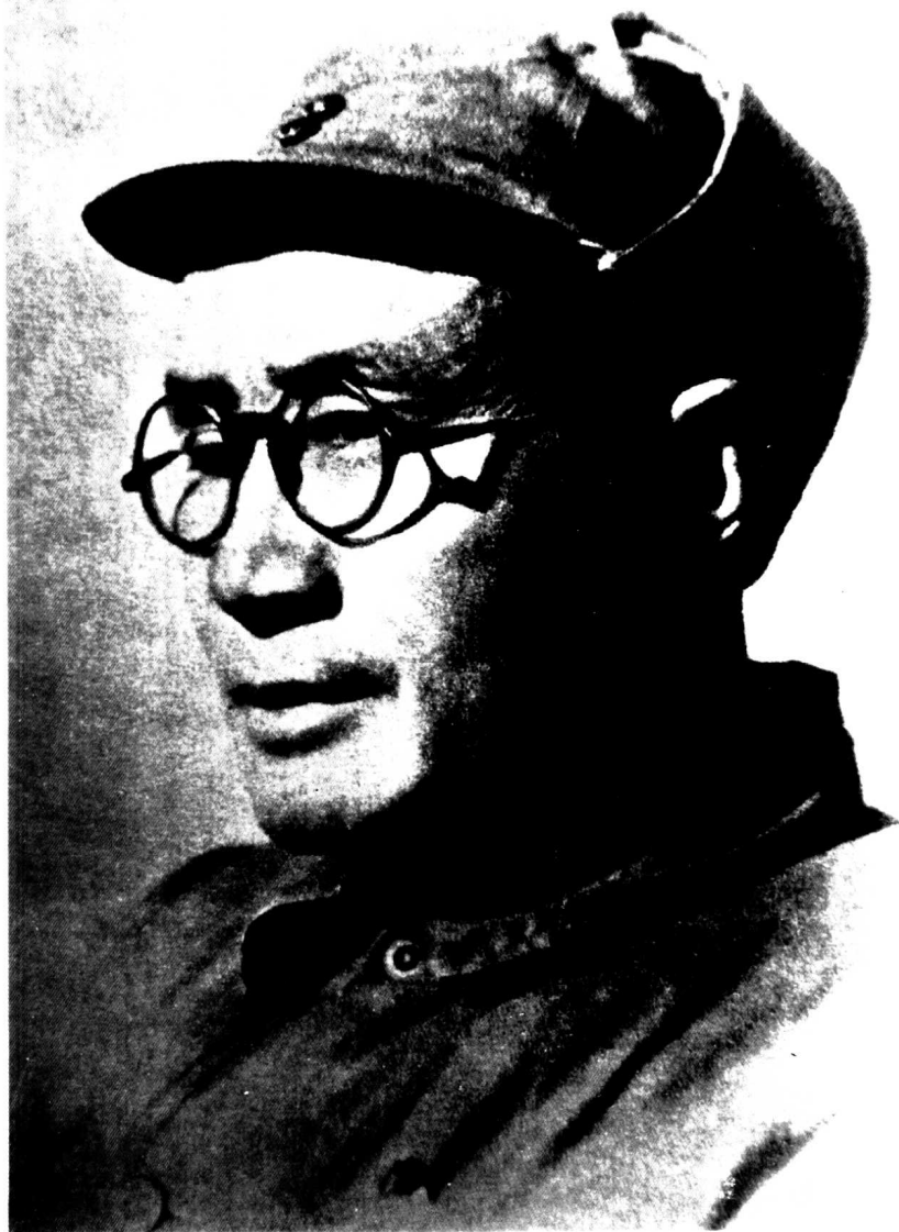
一二九师师长刘伯承。