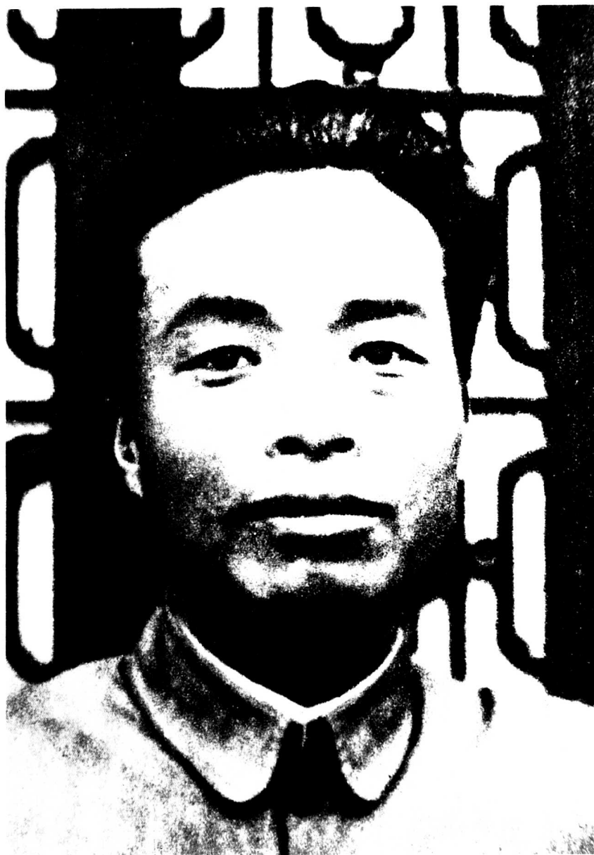
一二九师政委张浩，1938年2月由邓小平接任。