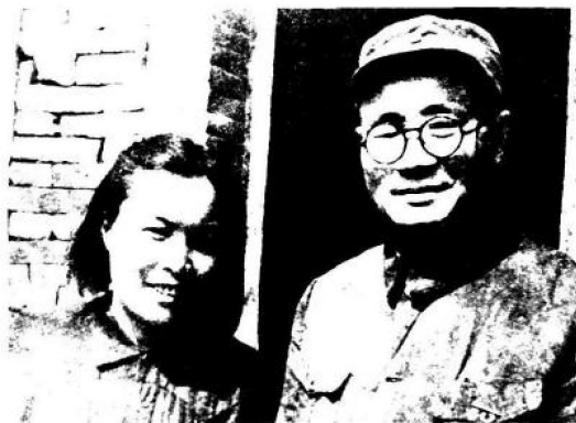
刘伯承与汪荣华，这对军中伉俪在长征路上恋爱、结婚，在八年抗战中又一起并肩战斗在太行山上。