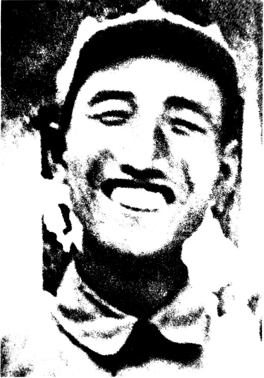
一二九师副师长徐向前。