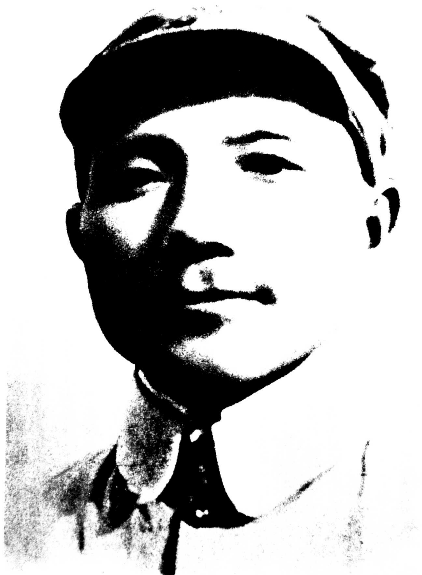
一二九师政委邓小平。