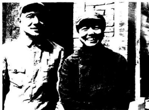
一二九师政委邓小平与夫人卓琳合影于太行山区的一二九师司令部。