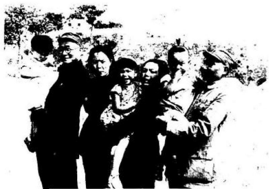
1945年，刘伯承、邓小平两家人在太行山合影。