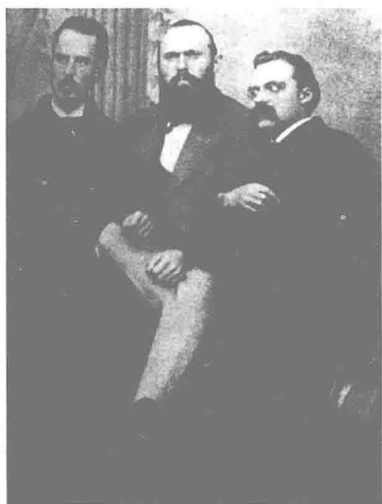
1871年10月中旬，从左至右：好友 欧文·罗德、卡尔·冯·格尔斯多 夫和弗里德里希·尼采