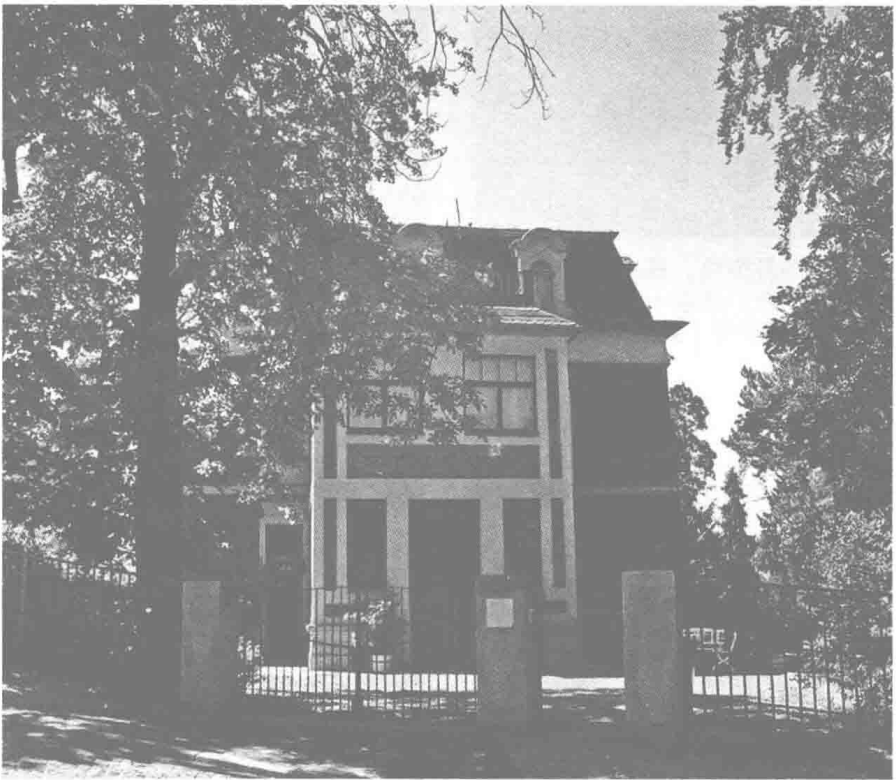
魏玛的尼采档案馆