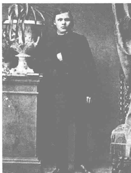
就读普福塔高等学校时的尼采（1861 年）