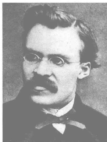
任教巴塞尔大学的尼采