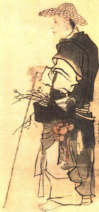
横云山民行乞图 1868年

横云山民行乞图 同治七年之冬胡三自题 横云山民行乞图 同治七年之冬胡三自题 横云山民行乞图 同治七年之冬胡三自题