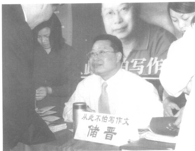
储晋老师签名售书