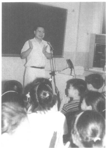
储晋老师到南京市学校免费讲学