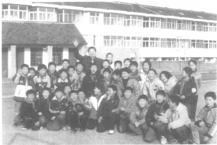
激流文学社成员合影