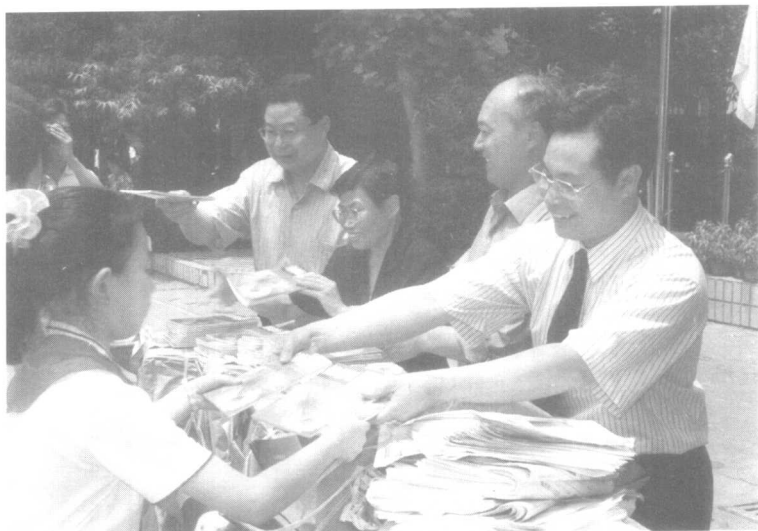
回母校南京铁路二小捐赠图书和VCD