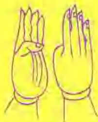
密教十八道法手印