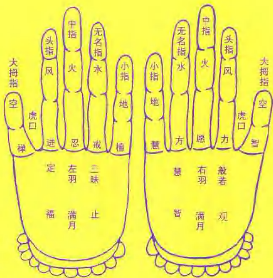
密教手印十指的别称