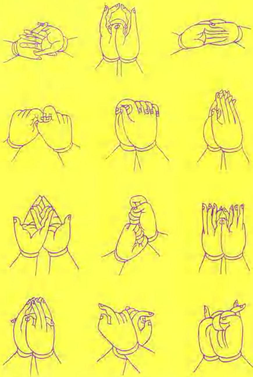
密教金剛界法手印