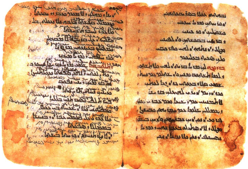
二 古叙利亚文《诗篇》节选（敦煌研究院藏品）