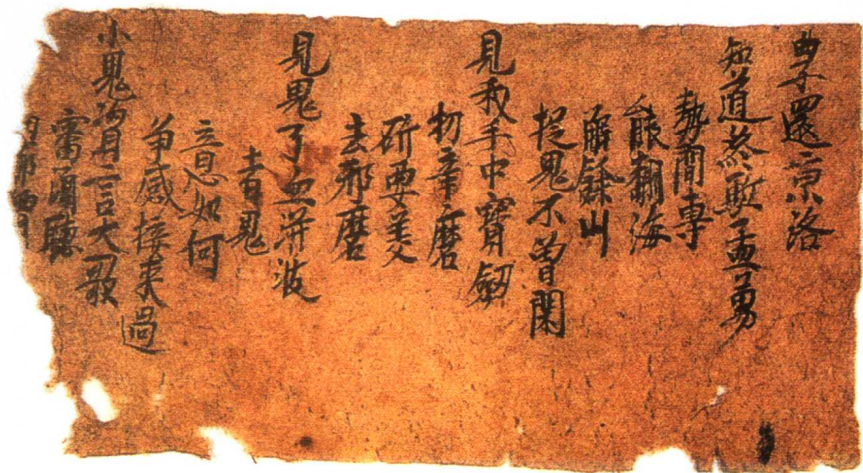
三 唐写本《曲子还京洛》（Jx.1468 号）