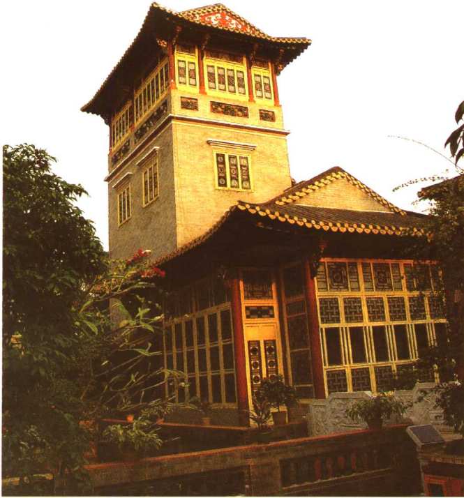
▼ 湛江海滨宾馆兰池