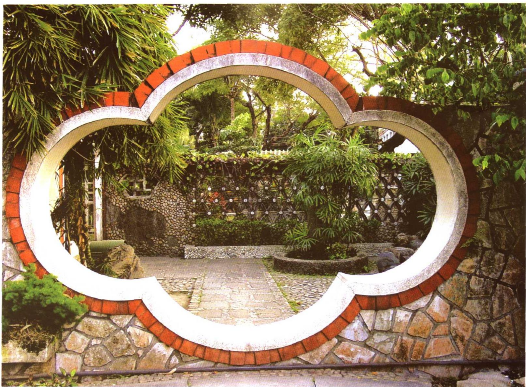
▲ 汕头中山公园梅门