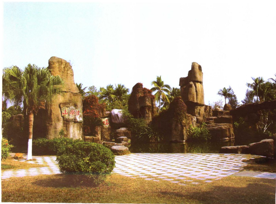
▼ 湛江海滨宾馆石林崖潭