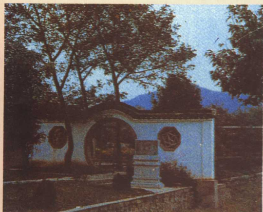
安徽當塗李白墓園