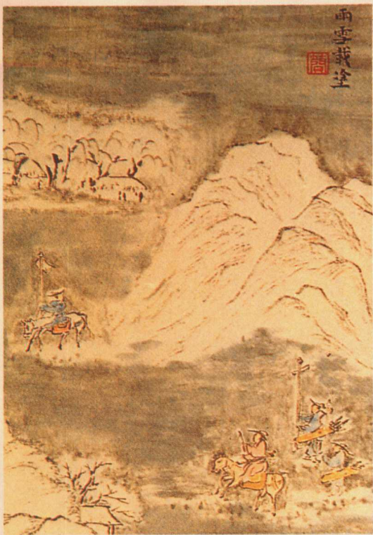
清·高修鶴繪《詩經圖譜慧解》