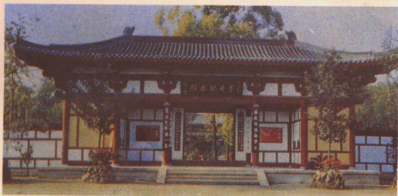
四川江油縣李白紀念館