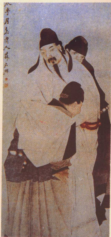
清 蘇六朋繪〈太白醉酒圖軸〉