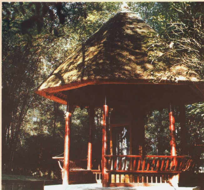
四川成都杜甫草堂