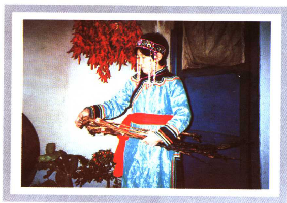
鄂伦春猎民