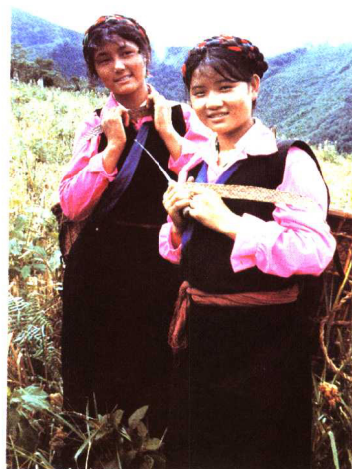
门巴族妇女