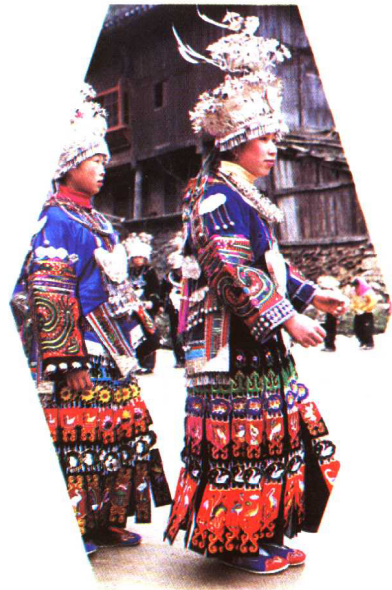
贵州雷山苗族