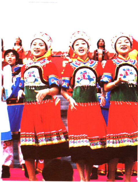
载歌载舞(土家族)