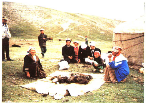
打羊毛的柯尔克孜族