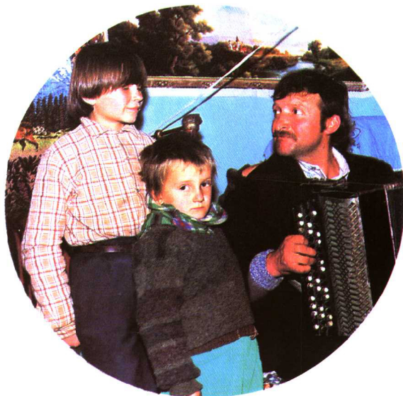
俄罗斯族家庭