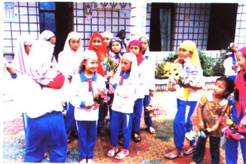
三亚回族儿童