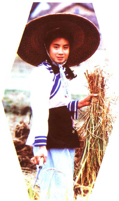
毛南族姑娘 民族文化宫博物馆供稿