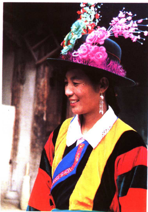
土族妇女夏常服