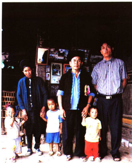
户撒阿昌族