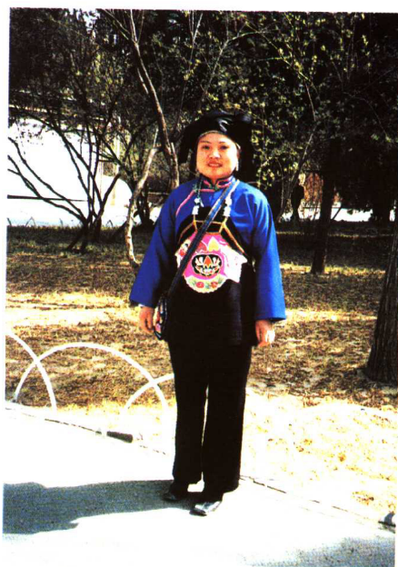
云南文山壮族女服