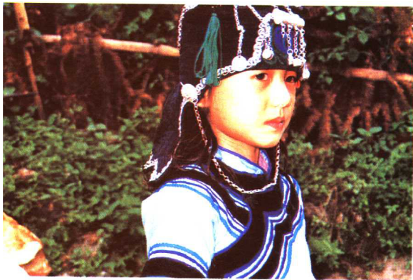
哈尼族姑娘