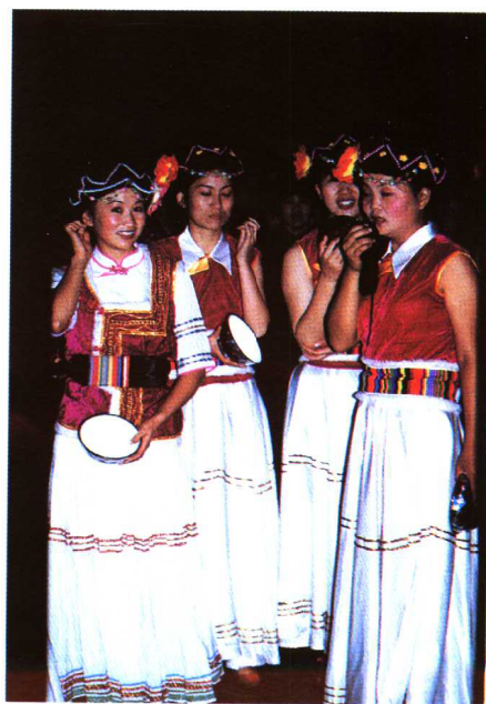
普米族姑娘