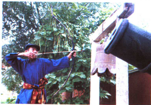
响箭(锡伯族)