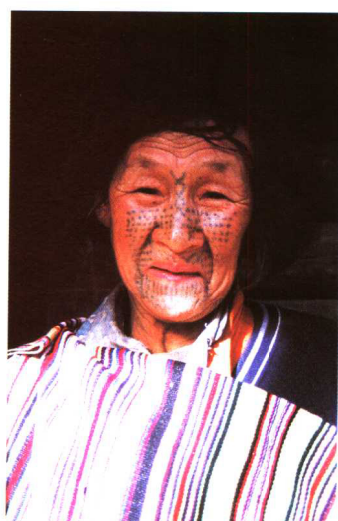
纹面老人(独龙族)