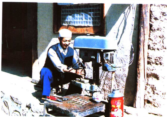
保安族制作腰刀