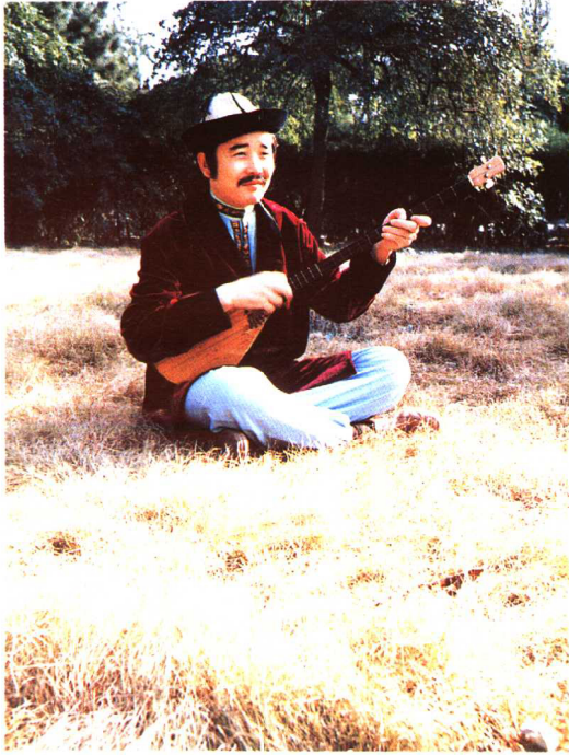
弹起心爱的冬不拉(哈萨克族) 中央民族大学民族博物馆供稿