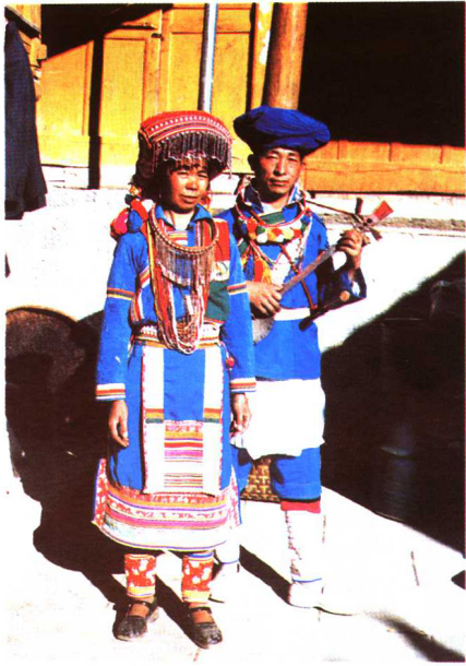
腾冲傈僳族盛装