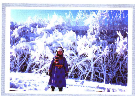
鄂温克儿童