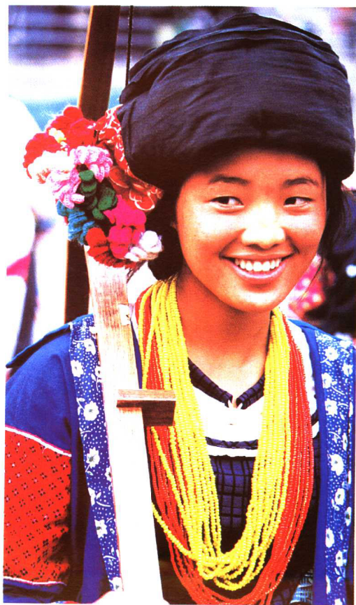
景颇族姑娘