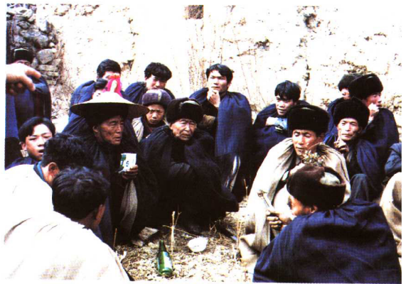
彝族送祖灵仪式