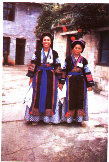
蜡染衣裙(布依族)