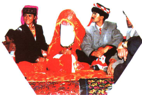
塔吉克族婚礼