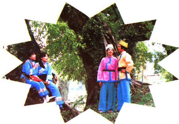
仡佬族青年 民族文化宫博物馆供稿