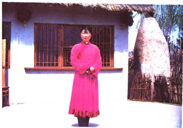
达斡尔族姑娘