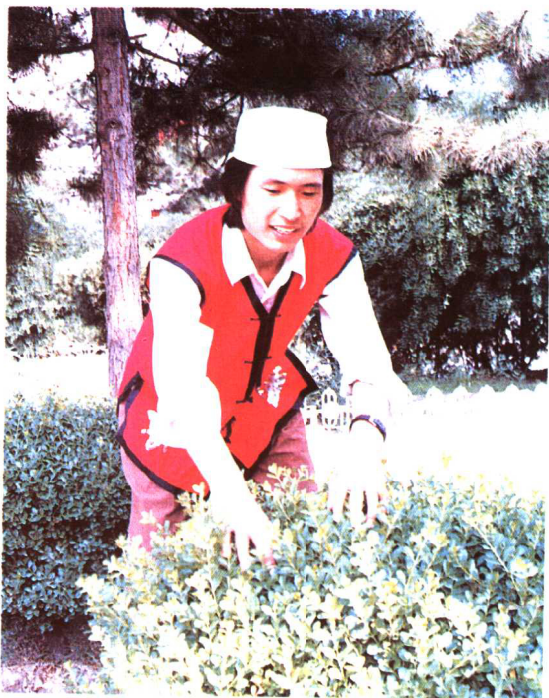
东乡族青年