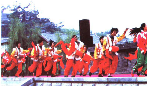
汉族腰鼓舞