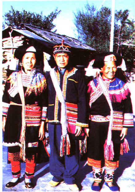
拉祜族老年服装