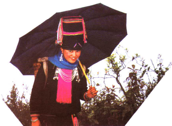
瑶族少女