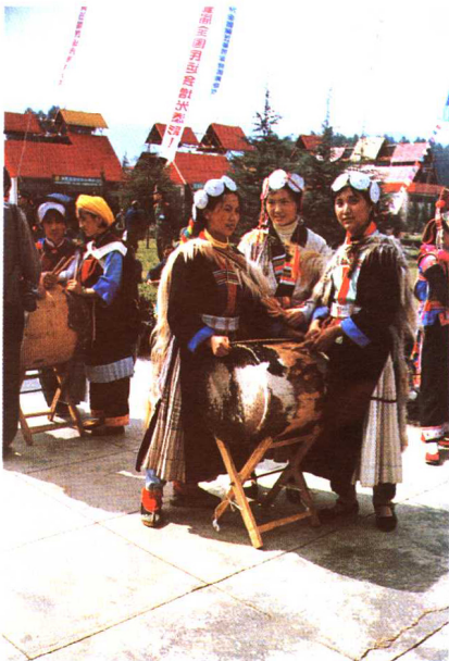
纳西族青年