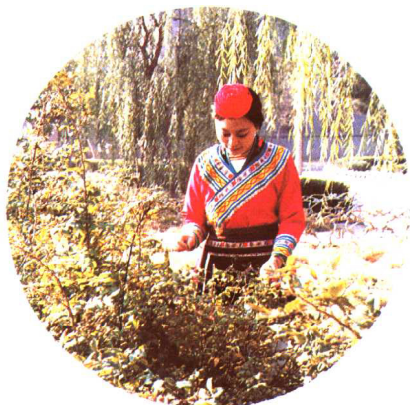
觅(畲族) 中央民族大学民族博物馆供稿