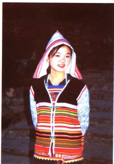
基诺族少女