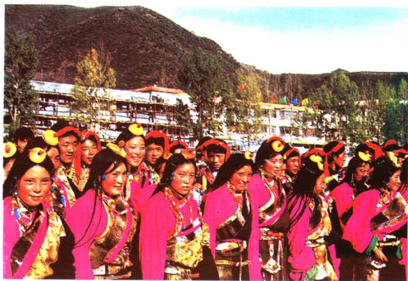
康巴藏族服饰