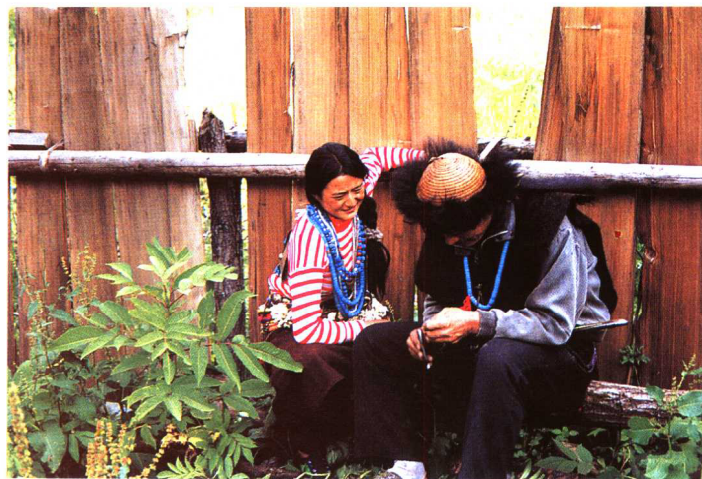
珞巴族男子正在用火镰取火