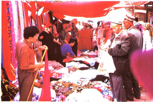
巴扎上的维吾尔族