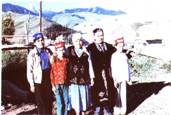
塔塔尔族家庭