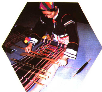
织锦(黎族)