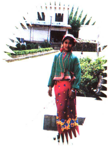
布朗族少女 杨筑慧摄