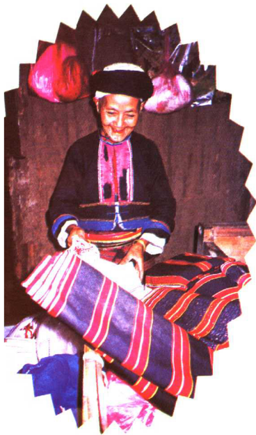
德昂族老人