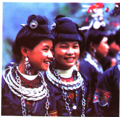
银装(侗族)