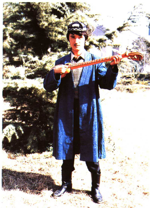
弹奏心曲(乌孜别克族) 中央民族大学民族博物馆供稿