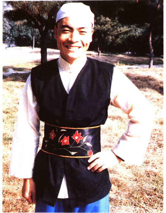
撒拉族青年