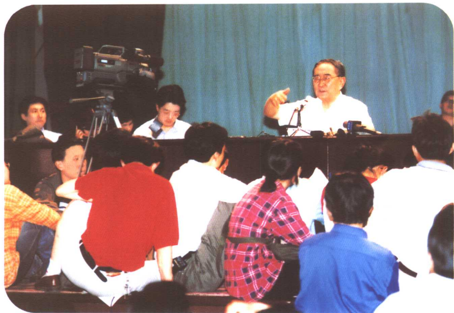
连讲桌前面的空隙也坐满了人