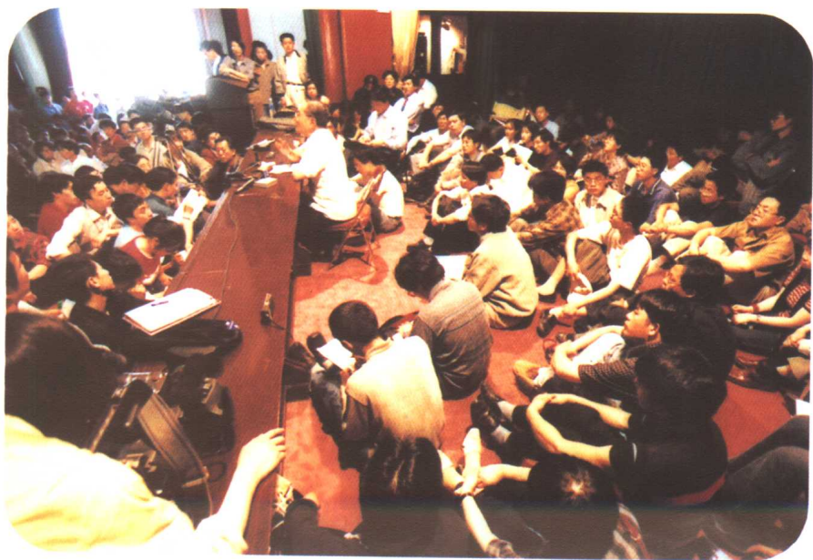
电教楼报告厅讲台上席地而坐的听众