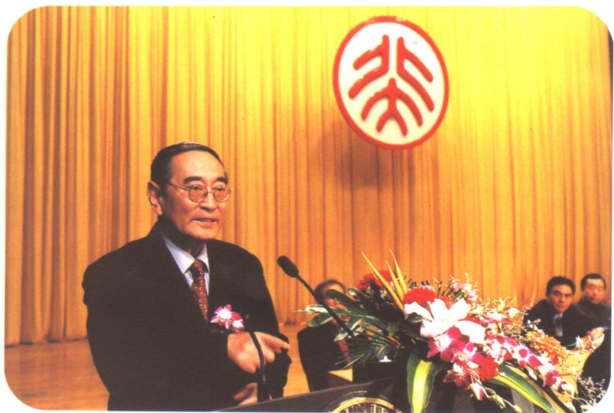
厉以宁在作学术报告