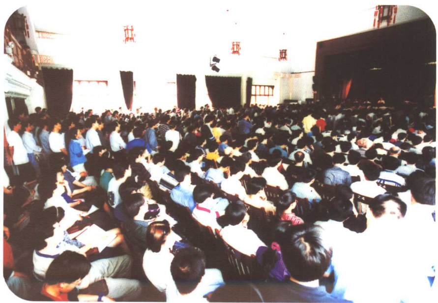
办公楼座位有限，所有的过道都挤得水泄不通