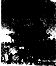
当代白族作家丛书