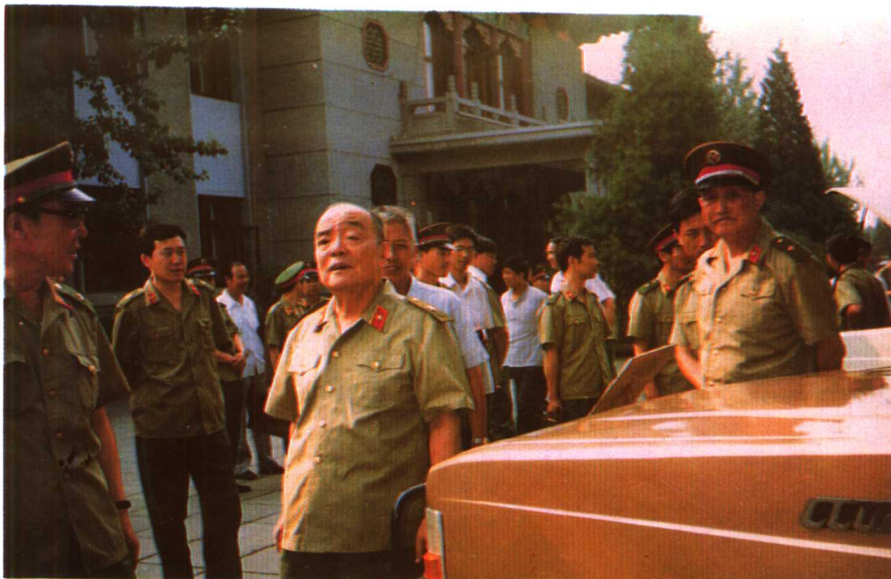
1987年7月，中央军委副主席杨尚昆在北京参观了由中国人民解放军总后勤部车船研究所和七四二七工厂共同开发研制的CAQ05A型轻型越野汽车。