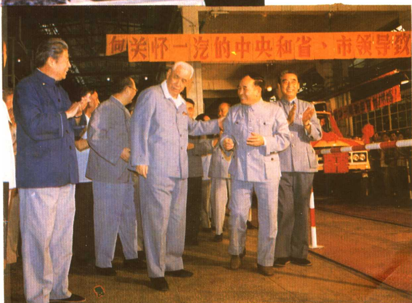
1986年7月15日，第一汽车制造厂职工热烈庆祝投产三十周年。图为段君毅（右三）、饶斌（左一）、高狄（右一）、何光远（右二）等领导同志参加CA141新车试生产剪彩仪式。