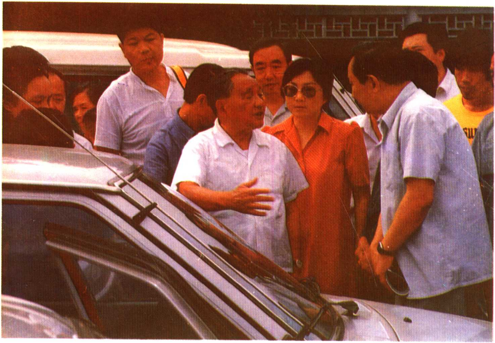
1986年8月22日，邓小平同志来天津视察时，参观天津市微型汽车厂生产的夏利牌轿车。