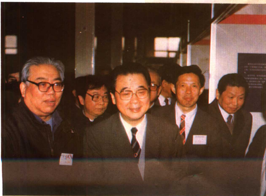
1987年4月16日，在北京举行《全国采用国际标准展览会》。图为李鹏副总理参观展览会的〔汽车标准化〕展室。