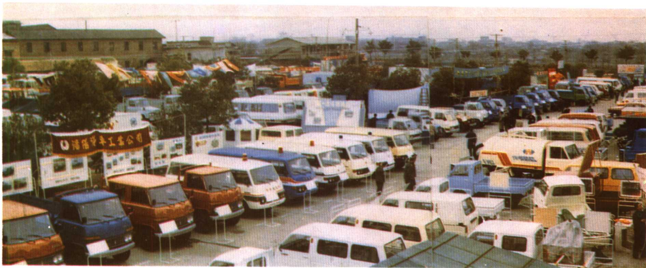
1986年3月19日，在长沙隆重举行全国汽车展销会。全国共109个厂家参加展销。图为展销会会场一角。