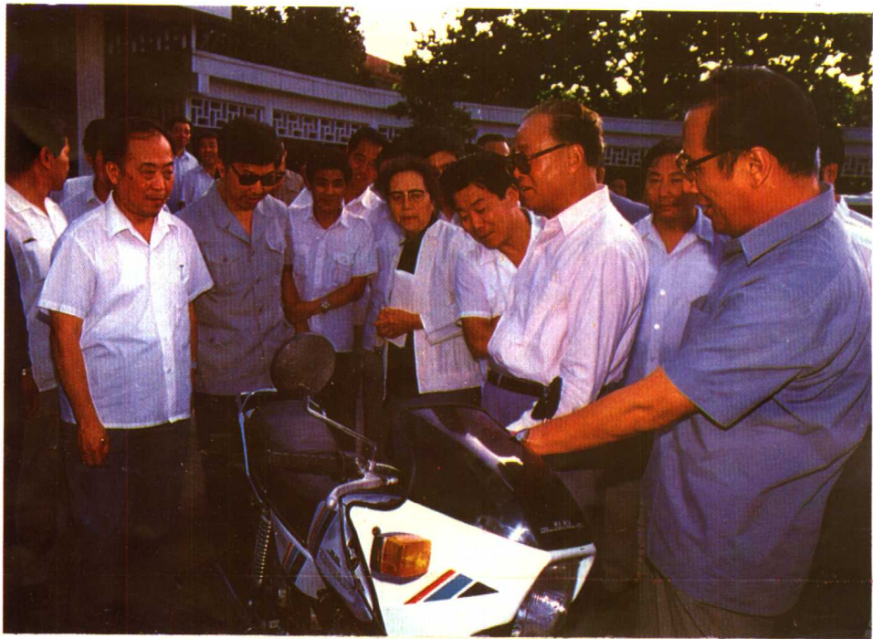
1986年4月，赵紫阳总理来天津视察时，参观天津摩托车厂生产的迅达牌摩托车。