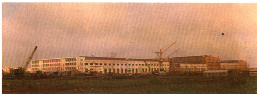
图为正在建设中的第一汽车制造厂第二厂区。