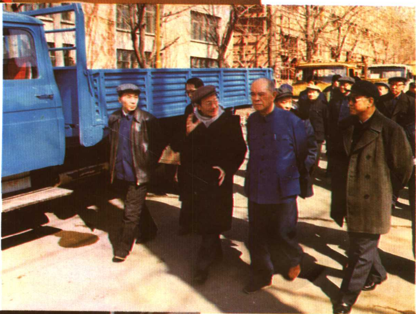
1986年3月17日，姚依林副总理在中国汽车工业公司、吉林省和第一汽车制造厂领导的陪同下，参观长春汽车研究所及其开发的新产品。