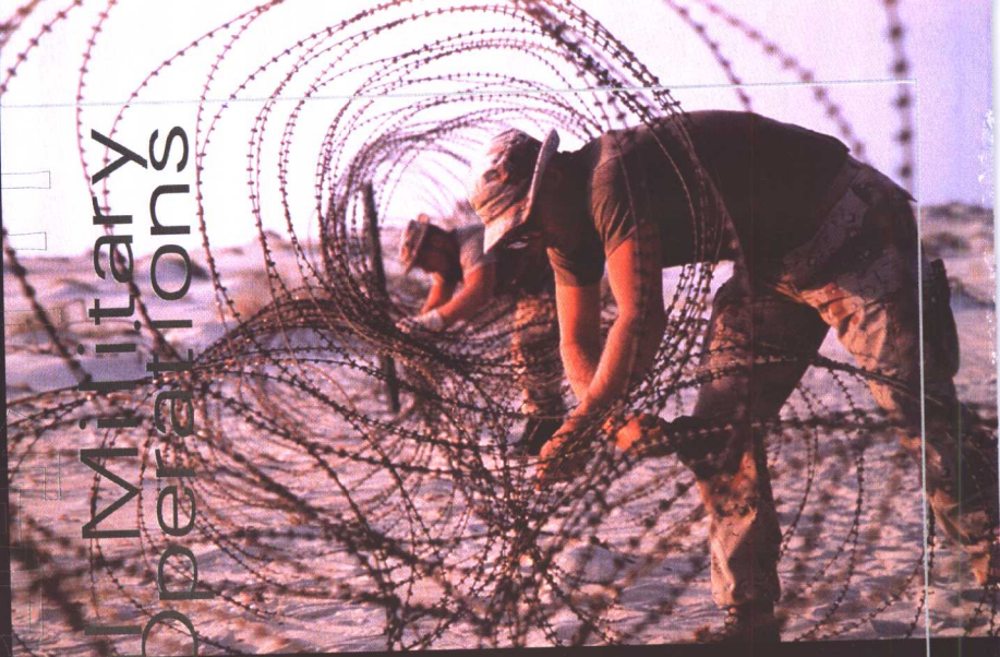
Special Military Operations