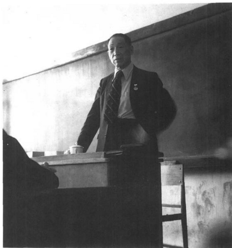
作者在北京大學講演國際公法時攝