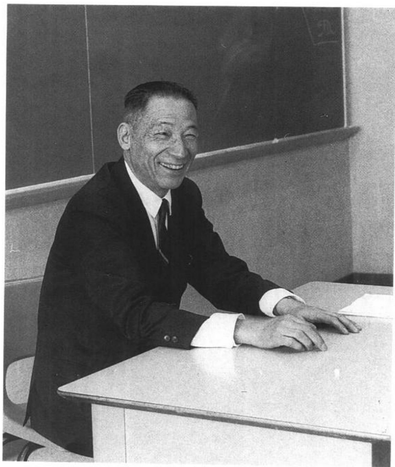
作者在紐約市立大學講課時攝 一九七五年五月