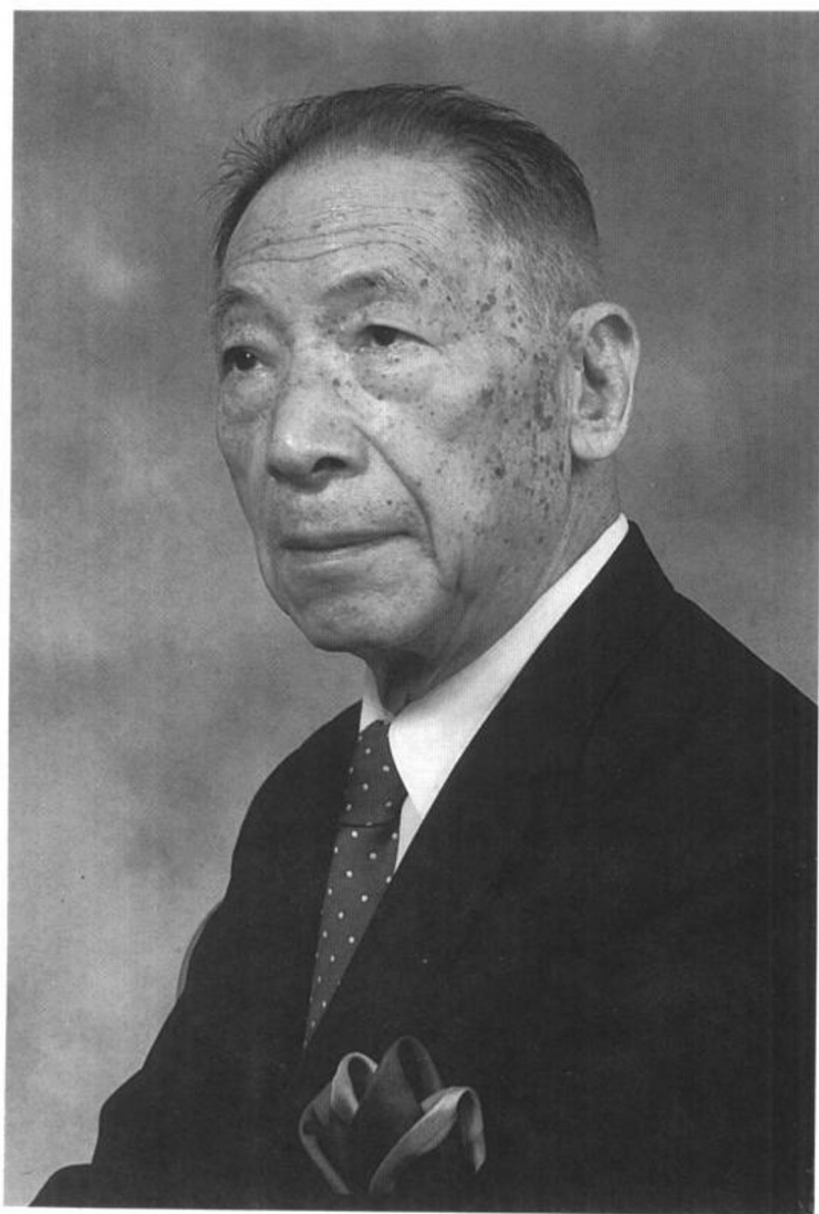
作者 董霖 一九九一年九月於紐約