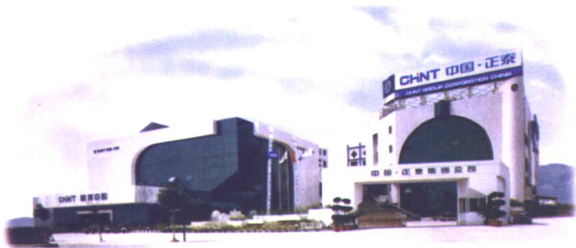
□ 中国正泰集团公司（温州乐清）