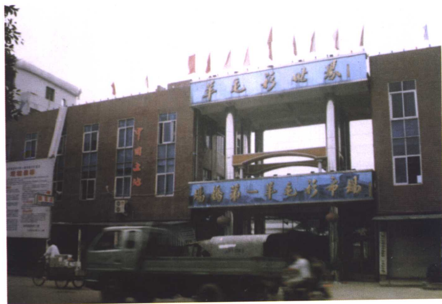
□ 温州瑞安羊毛衫市场