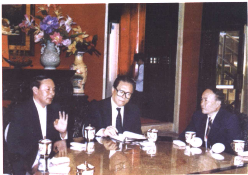
□ 江泽民同志视察温州