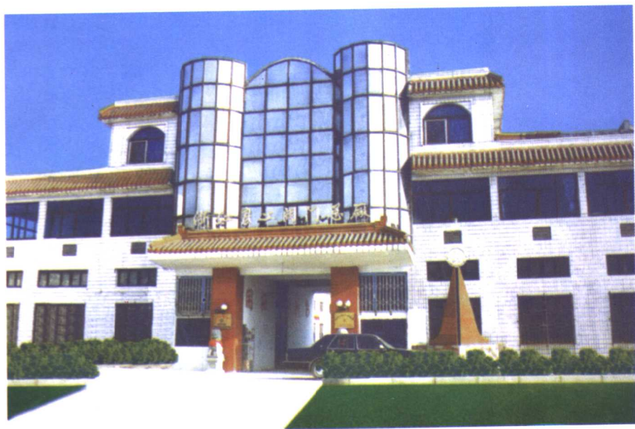
□ 浙江良工阀门厂（温州瓯海）