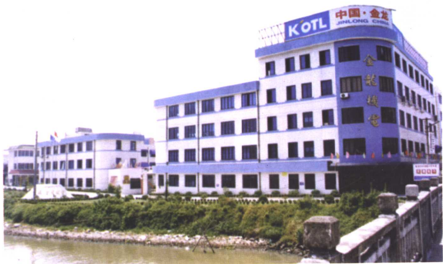
□ 中国金龙机电有限公司（温州乐清）