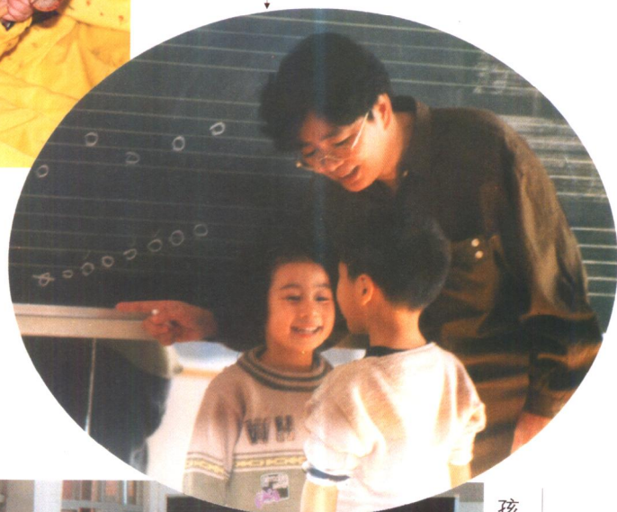
孩子们在《划龙舟》课上玩游戏。