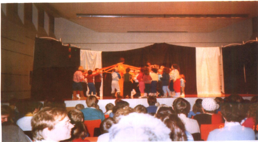
奥尔夫学院内设有儿童 活动中心，是学生实践的场 所。那里经常组织师生甚至 家长一起表演儿童剧。