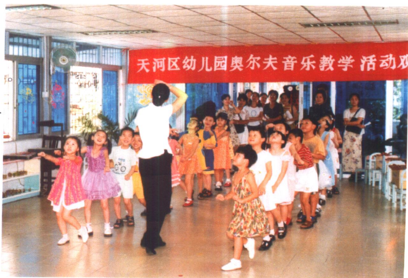
1999年在天河区教育局组织下，区海婴为本区举办了两期奥尔夫教学法师资培训班这是培训班学员结业时的教学观摩活动。