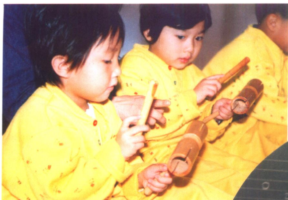
↑ 孩子们兴致勃勃地使用打击乐器为乐曲伴奏。