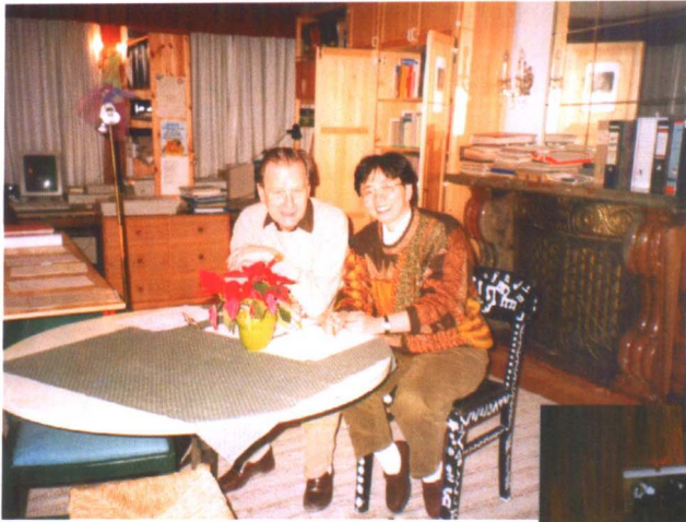
1998年区海婴赴奥地利与她的导师、原奥尔夫学院院长雷格纳尔教授在其工作室中会面，向他介绍在中国开展奥尔夫教学的情况。