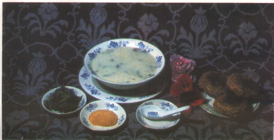
全 羊 汤