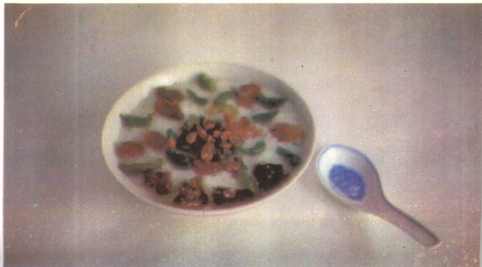
腊 八 粥