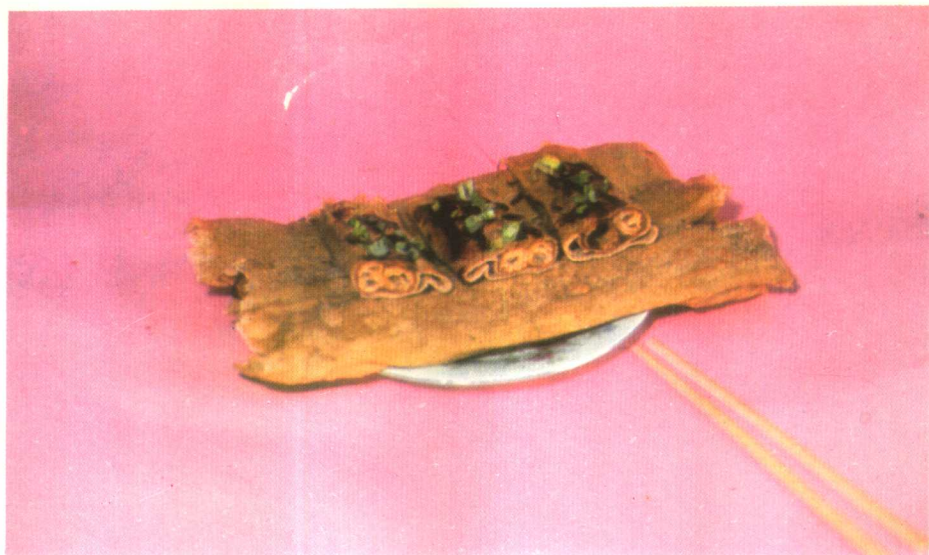
煎 饼 馓 子