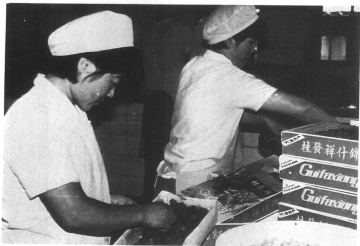
“桂发祥”麻花公司的 职工们在分装麻花