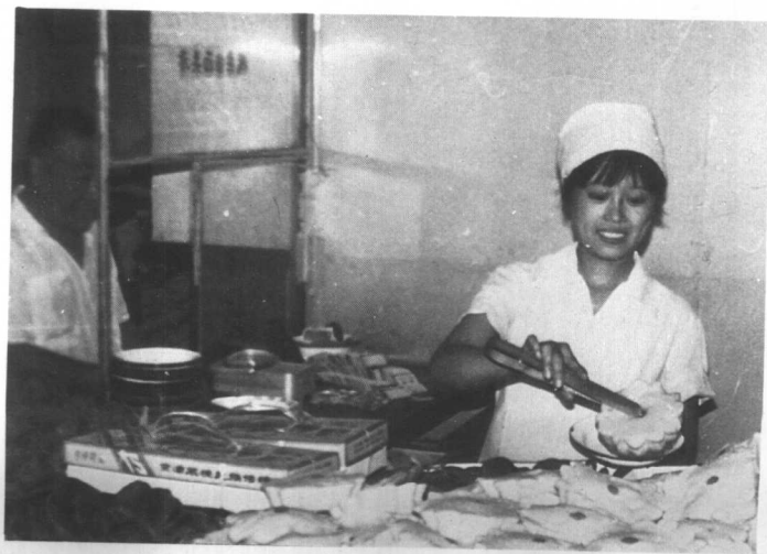
“京津小吃店”的职工在售货