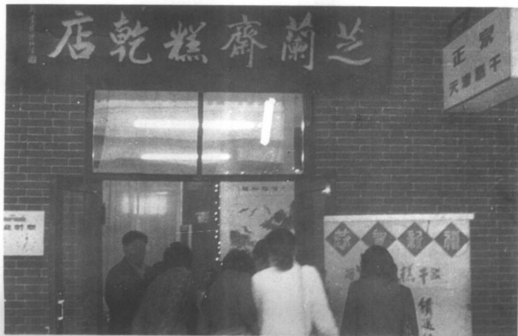
座落在南市食品街的“芝兰斋”糕干店