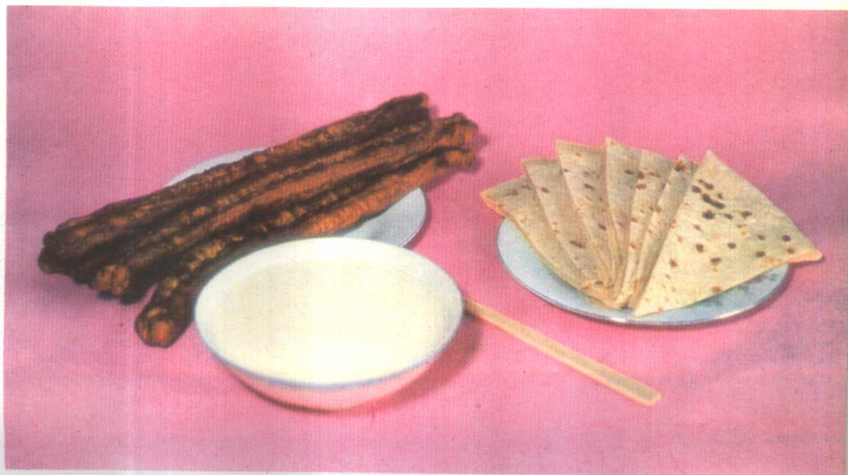
大饼、棒槌饅子、豆浆