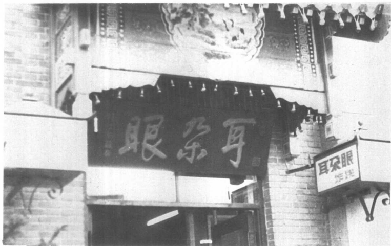
座落在南市食品街的“耳朵眼”炸糕店