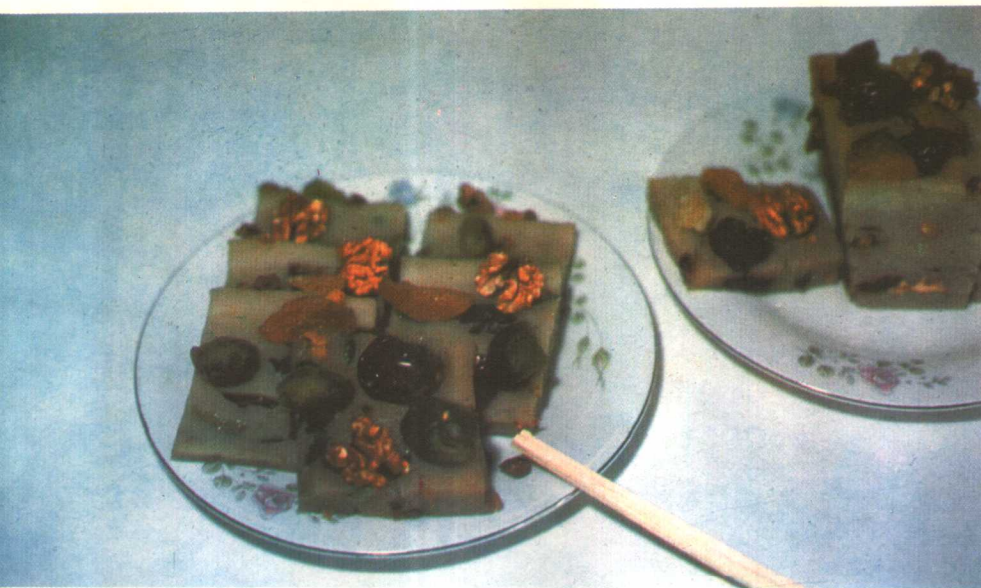
如 意 年 糕