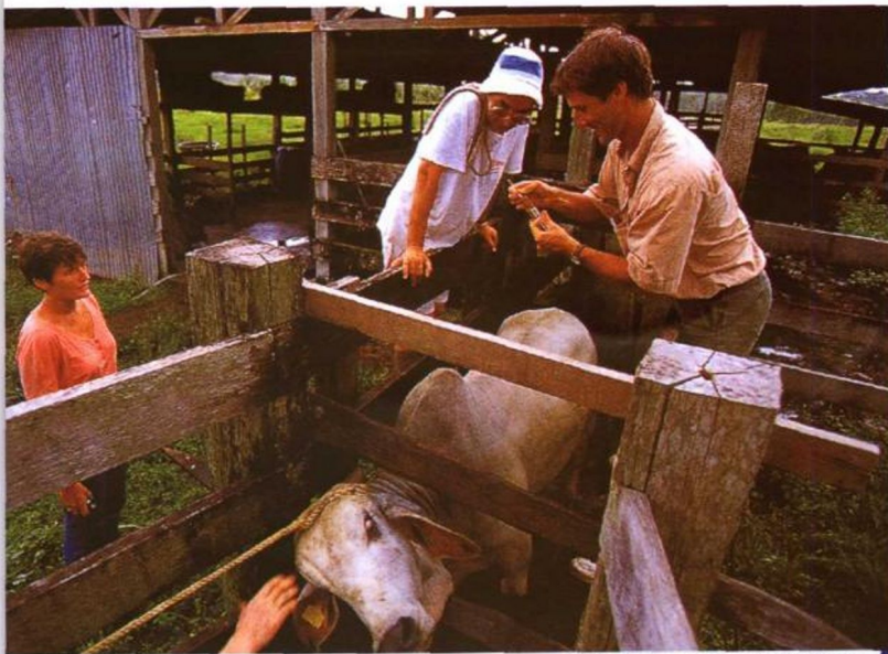
在法属圭亚那给牲畜作检查