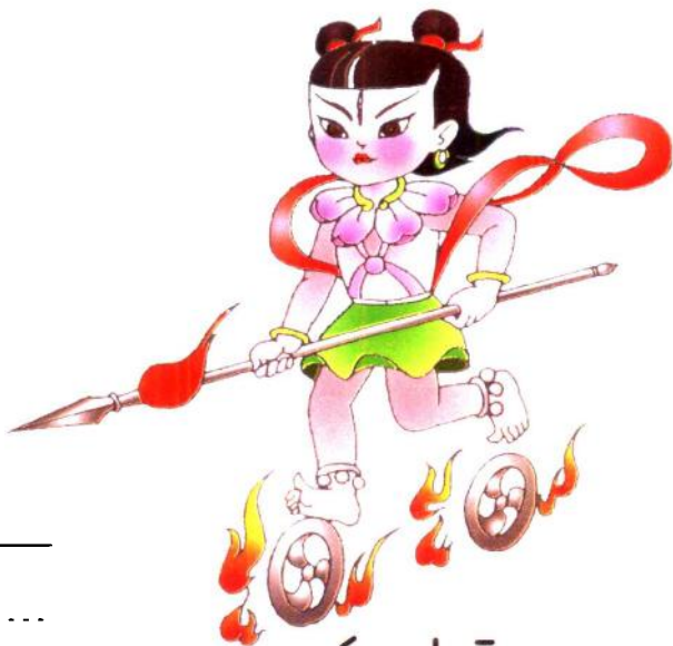
né zhā 哪 吒